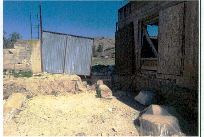
Güneyinde yer alan ve Müzesince çalışma yapılacak olan 30 parsel

Handwritten blue ink marks, including a stylized 'S' and a signature-like mark.