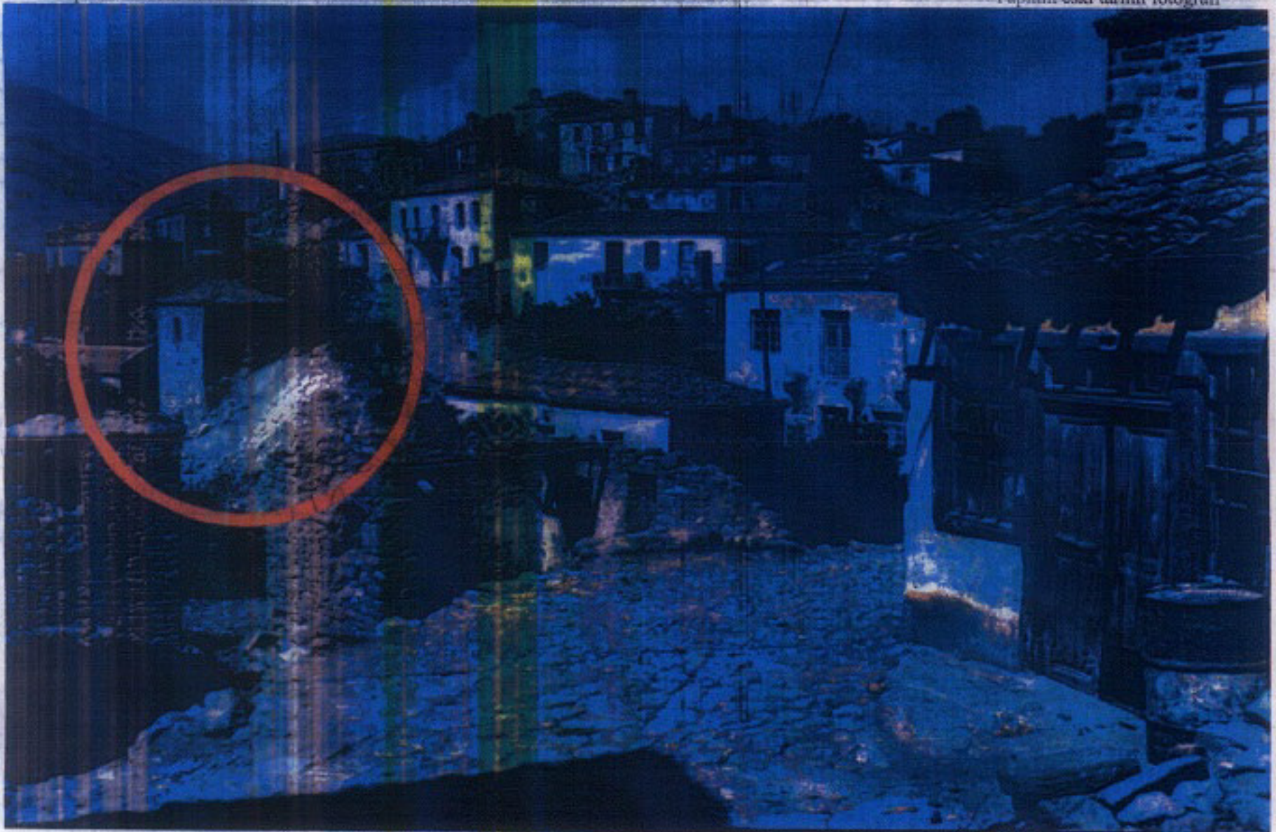
Yapının eski tarihli fotoğrafı