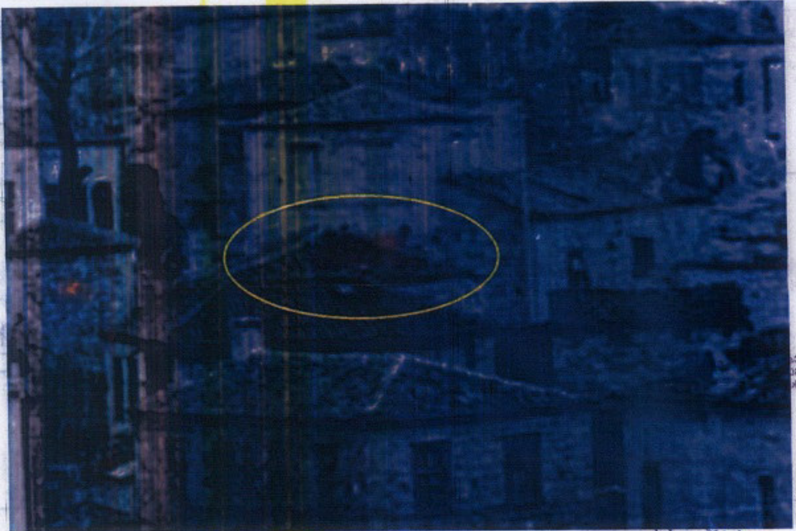
Yapının eski tarihli fotoğrafı