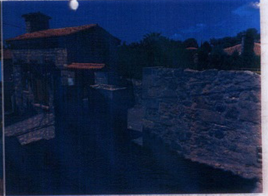
Yapının mevcut durumu