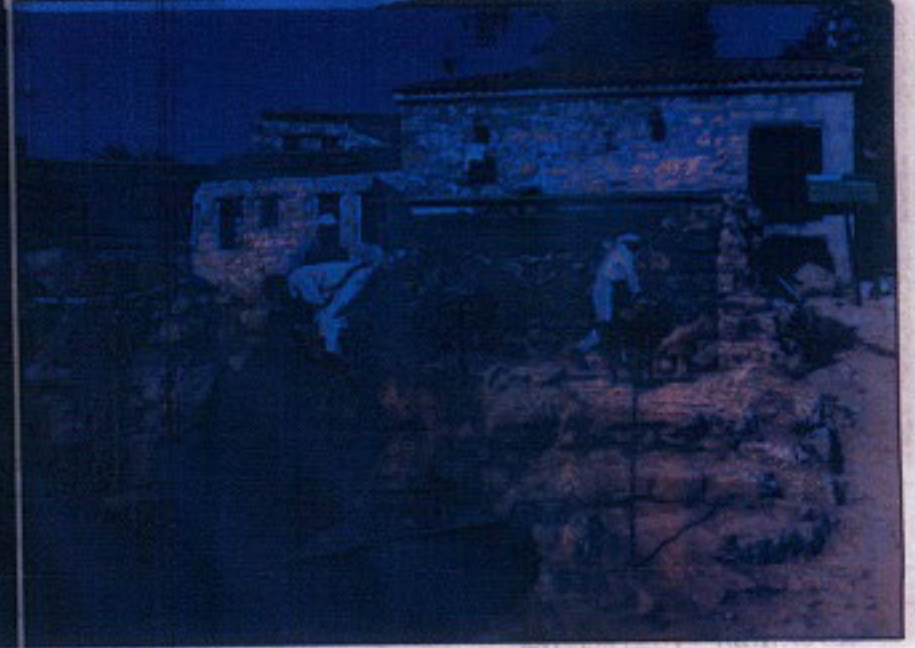
Yapının temel kazısı sonrası durumu