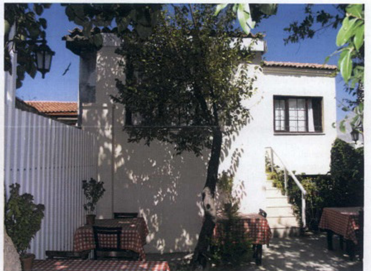
(PARSELDEKİ YAPININ YENİ HALİ)