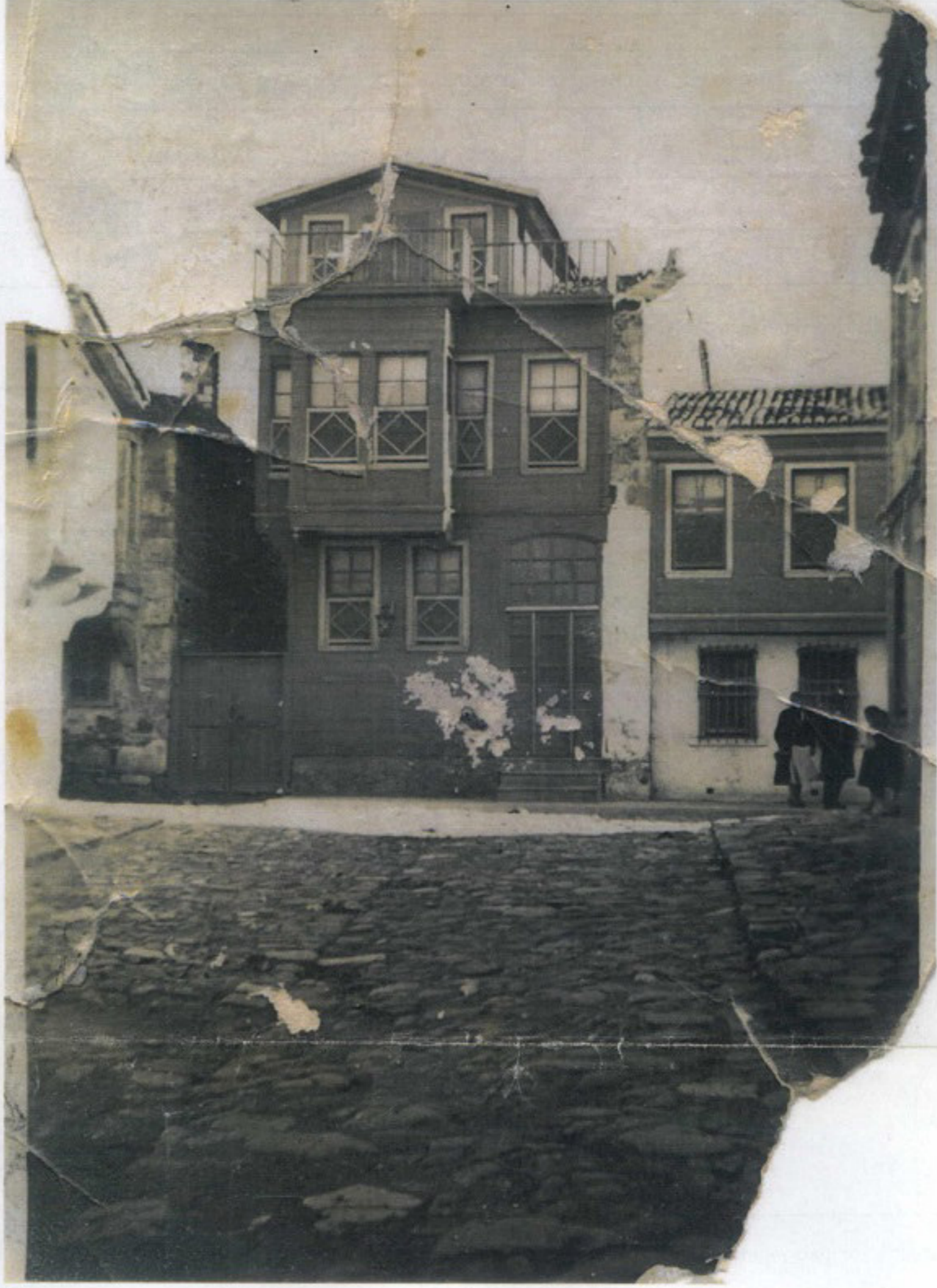
(PARSELDEKİ YAPININ ESKİ HALİ)