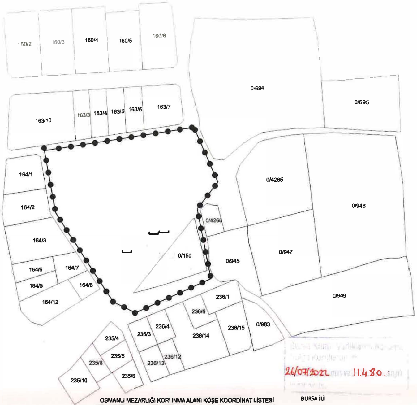
OSMANLI MEZARLIĞI KORUNMA ALANI KÖŞE KOORDİNAT LİSTESİ