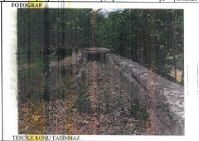
TESCİLE KONU TAŞINMAZ

GÖZLEMLER: Görüntüde kullanılmamakla birlikte, oldukça iyi durumda bir yapıdır.