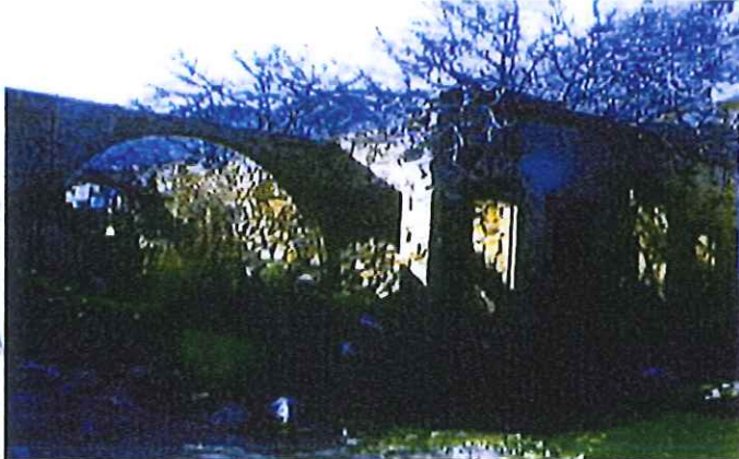
Rekonstrüksiyon-Restorasyon yapılmadan önceki hali