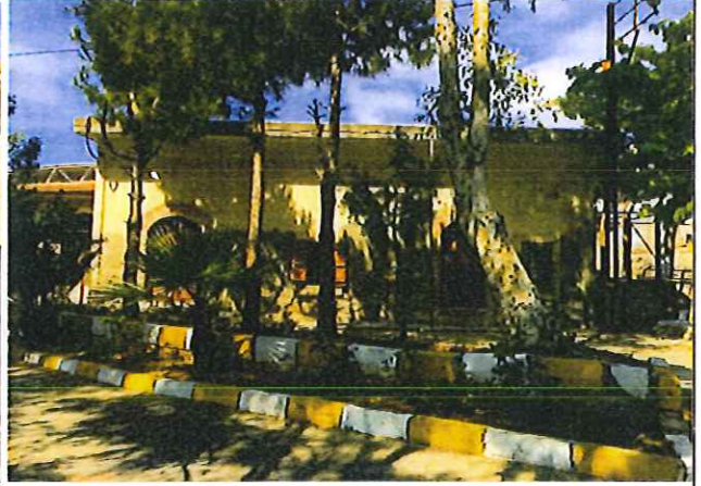
725 parseldeki tescilli taşınmaz kültür varlığı yadı