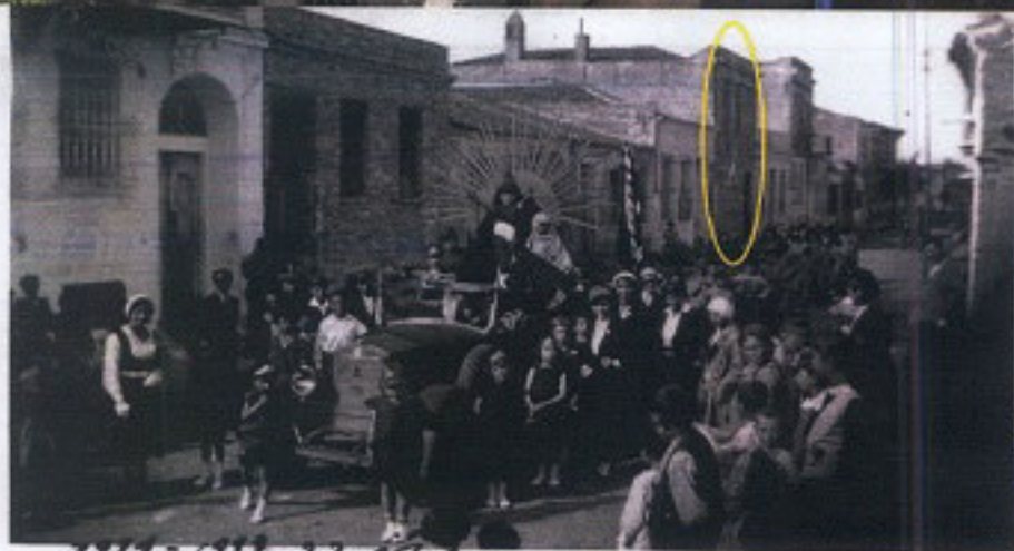
1914-1932 27 Ağustos