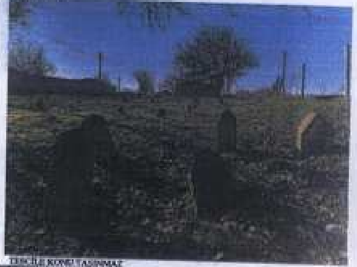
TEKİLE KÖYÜ / ÇANAKKALE

GÖZLEMLER: Yerleşim bölgesi dışında sınırlarda bulunan mezarlık alan, tapınak inşaatı belirli aralıklarla yapılan gözetim amaçlı raporlarla takip edilmekte.