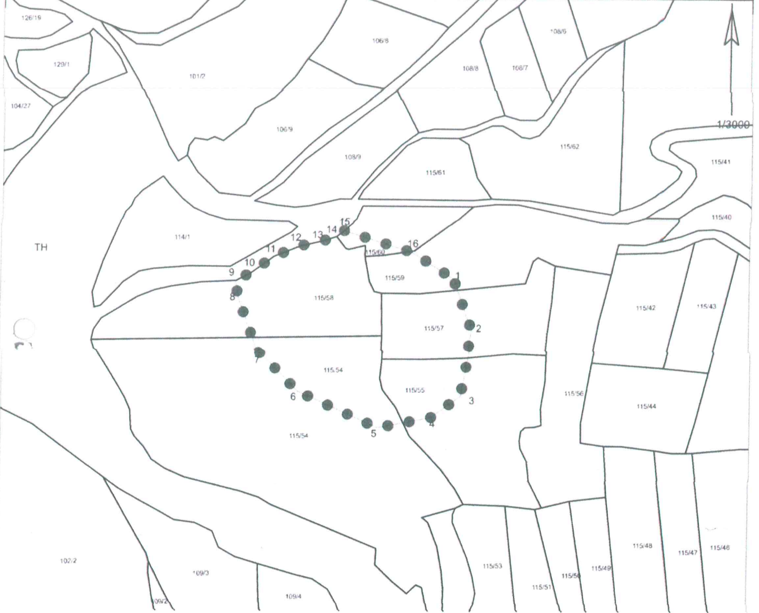
KOORDİNAT ÖZET ÇİZELGESİ UTM 3 ITRF 96