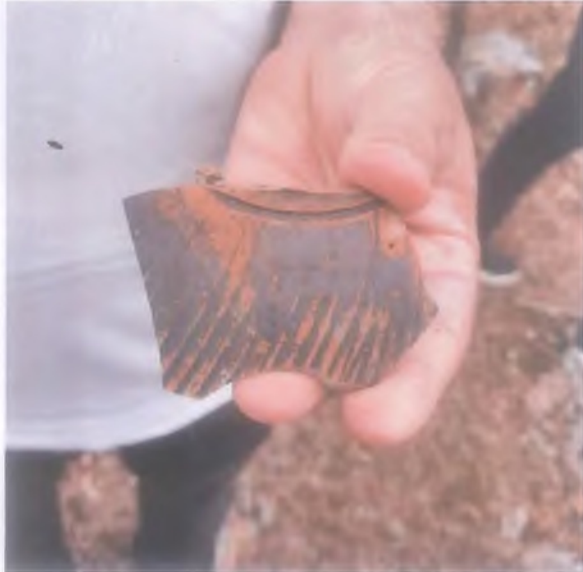
Arkeolojik buluntuların bulunduğu alandan görünüm

T.C. KÜLTÜR VE TURİZM BAKANLIĞI İzmir 2 Numaralı Kültür Varlıklarını Koruma Bölge Kurulu Müdürlüğü