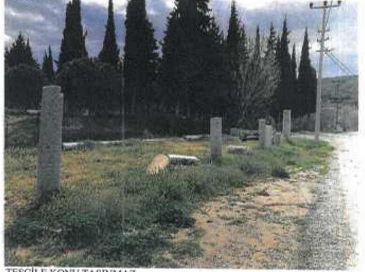
TESCİLE KONU TAŞINMAZ

GÖZLEMLER: Antik dönem mimari parçaları kırsal mezarlık alanındaki peyzaja katkı sunmaktadır.