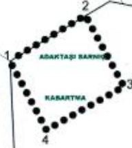
KORUMA ALANI KOORDİNAT ÖZET ÇİZELGESİ UTM 3 ITRF 96 UTM 6 ED 50