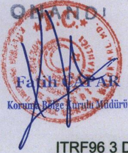
ITRF96 3 Derecelik Koordinatlar UTM Ed-50 6 Derecelik Koordinatlar

Kayseri Kültür Varlıklarının Koruma Bölge Kurulunun 27.08.2024 Gün ve 7545.Sayılı karar ektidir.