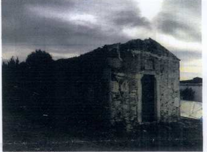
TESCİLE KONU TAŞINMAZ

GÖZLEMLER: Yapının üst örtüsü çökmüş, giriş aksındaki kitabesi kırılmış, iç duvar sıvaları dökülmüş durumda olup, metruk bir vaziyettedir.