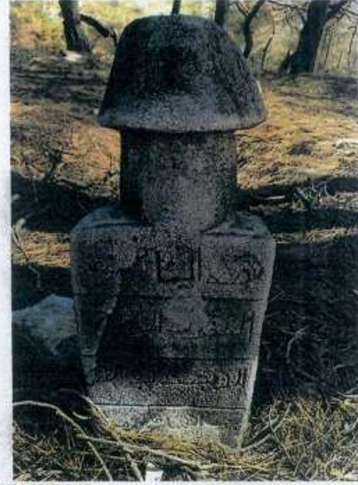
TESCİLE KONU TAŞINMAZ