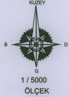
ITRF96 UTM 3 Derecelik Koordinatlar