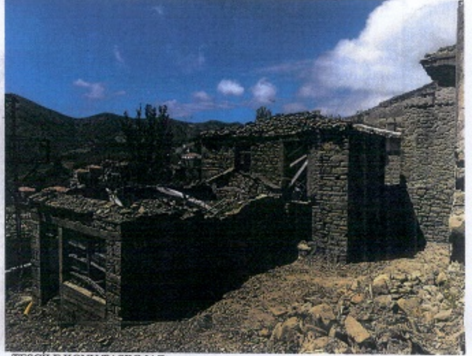
TESCİLE KONU TAŞINMAZ

GOZLEMLER: Zemin üzeri bir normal kattan oluşan ahır barnak bölümüne hizmet eden yaşam alanı ile tek katlı fırın yapısı günümüzde bakımsız vaziyettedir.