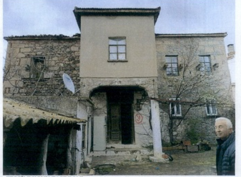
TESCİLE KONU TAŞINMAZ

GÖZLEMLER: İki katlı geleneksel konut örneği, taş inşa malzemesi, ahşap iç yapı detayları ve çatı sistemi ile sağlam bir biçimde günümüze kadar yaşamını sürdürdüğü görülmüştür.