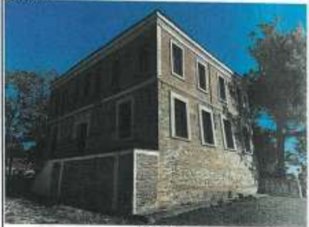
1 Katlı Yapı

GÖZLEMLER: Parselin güney kısmında 2 katlı ana yapı ve tek katlı bir yapı, 2 katlı yapının kuzeyinde bir kütüphane, batı kısmına dayanan tek katlı bir müstakil yapı, kuzey kısmında sapaç seviyesi yüksek olan tek katlı depo yapıları bulunmaktadır.