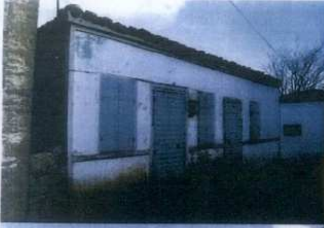
YAPININ ESKİ DURUMU