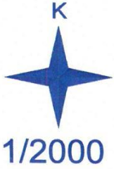
ITRF 3 DERECE KOORDİNATLAR