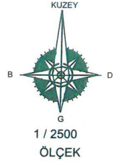
ITRF96 UTM 3 Derecelik Koordinatlar