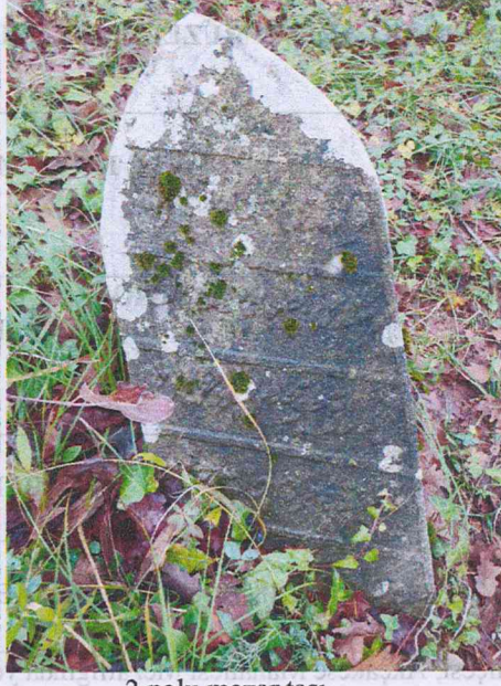
3 nolu mezar taşı