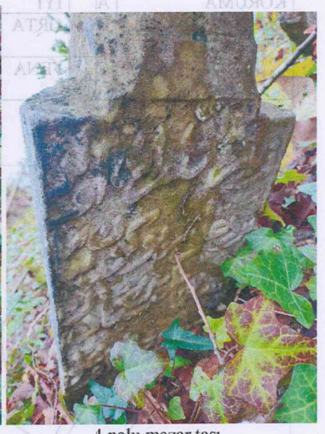
8 nolu mezar taşı