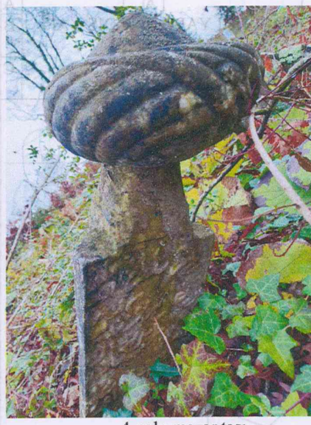
7 nolu mezar taşı