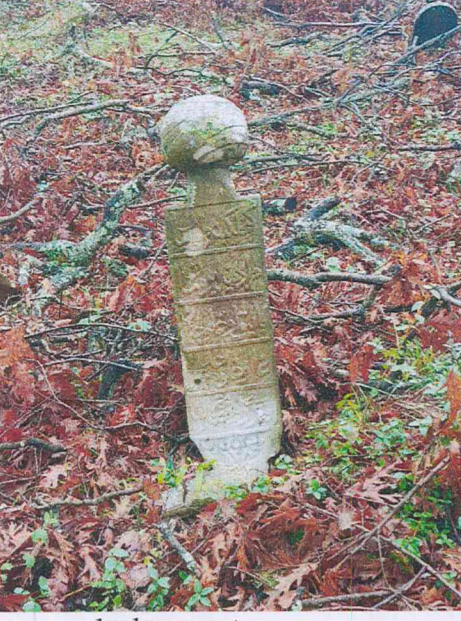
1 nolu mezar taşı