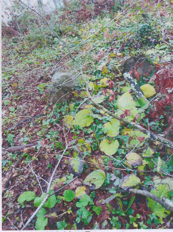
10 Nolu Mezar Taşı