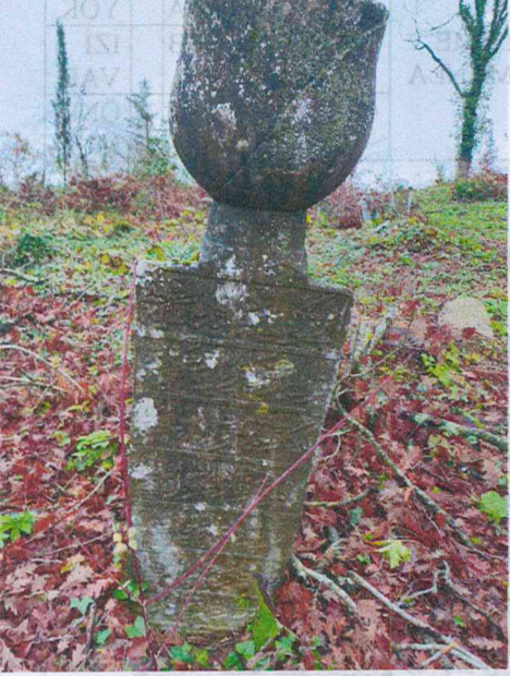
5 nolu mezar taşı