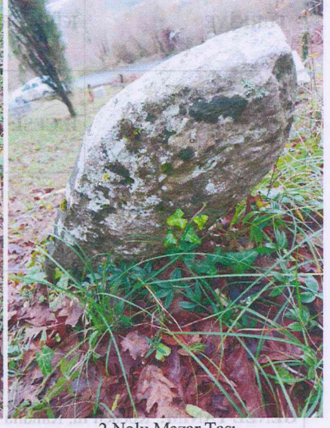
4 Nolu Mezar Taşı