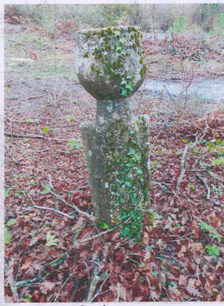
6 nolu mezar taşı