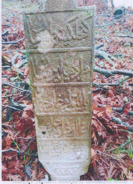
2 nolu mezar taşı