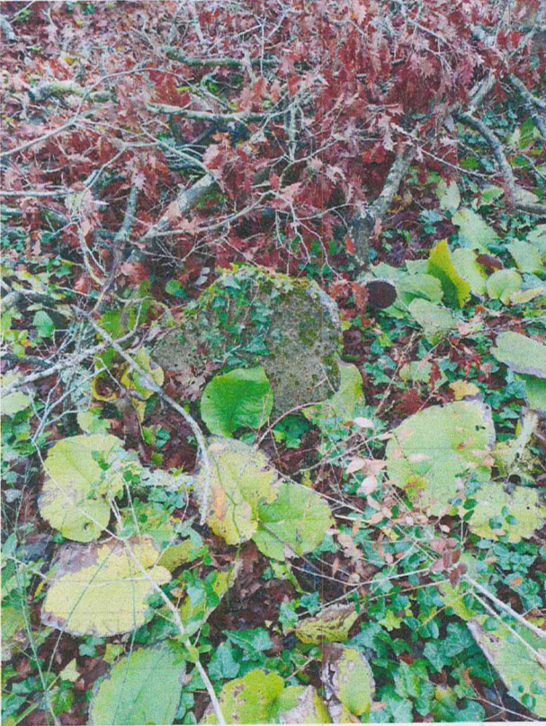
9 Nolu Mezar Taşı