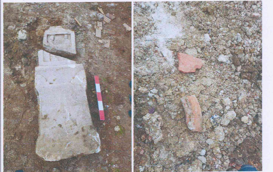
(Mezar Steli Fotoğrafi-25.04.2024 tarihli Yalova Müze Müd.Uzman Raporundan alınmıştır.)

Kocaeli Kültür Varlıklarını Koruma Bölge Kurulunun 23.07.2024 gün ve 7284 sayılı karan ekidir.