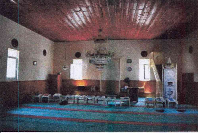
İç mekandan görünüş