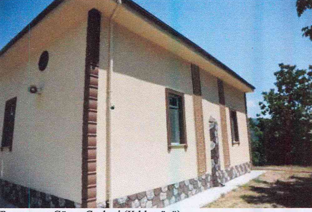
Taşınmazın Güney Cephesi (Kible yönü)