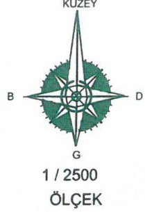
ITRF96 UTM 3 Derecelik Koordinatlar