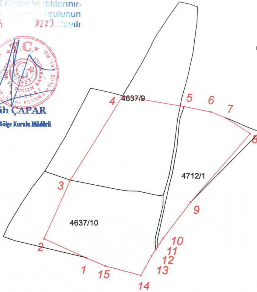
ITRF96 UTM 3 Derecelik Koordinatlar