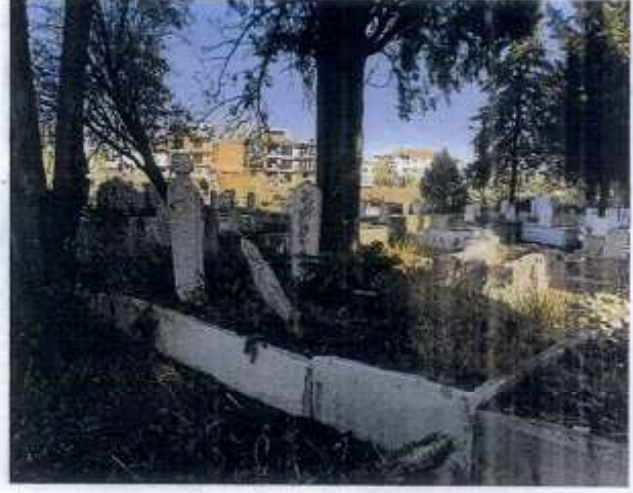
TESCİLE KONU TAŞINMAZ

GÖZLEMLER: Mezarlık alanı ve şehitlik bölümünün bahçe duvarları, mezar yapı ve şahidelerinde bakım onarım ihtiyacı bulunmaktadır.