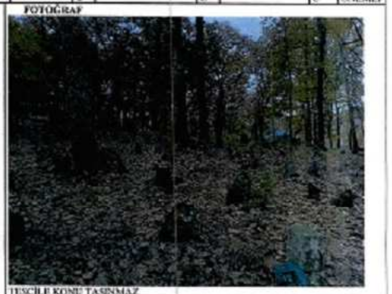
TÜSCHLE KONU TAŞINMAZ

GÖZLEMLER: Tarihsel süreçte defnelerin devam ettiği mezarlık alanı yoğun biçimde çalı-çırpı ve ağaçlar ile kaplı görünmektedir.