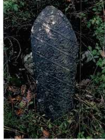
TESCİLE KONU TAŞINMAZ

GÖZLEMLER: Tarihsel süreçte definlerin devam ettiği mezarlık alanı yoğun biçimde çalı-çırpı ve ağaçlar ile kaplı vaziyettedir.