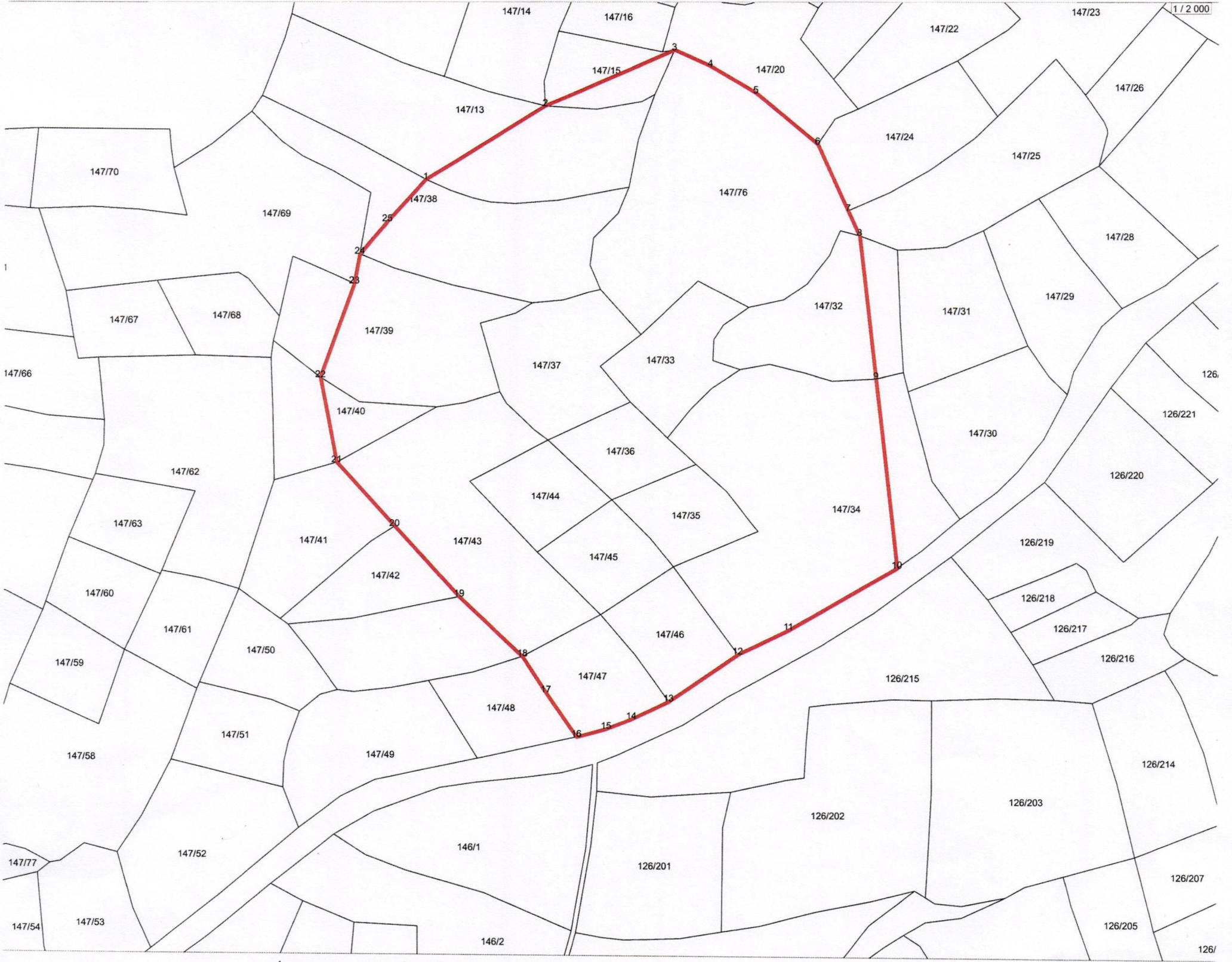
SİT ALANI KOORDİNAT TABLOSU