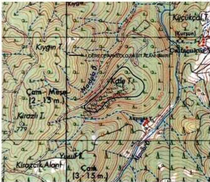
ÇANAKKALE İLİ, YENİCE İLÇESİ, ARMUTÇUK KÖYÜ, 101 ADA, 152 PARSELDE YER ALAN, AKPINAR KALESİ, I.DERECE ARKEOLOJİK SİT ALANI HARİTASI