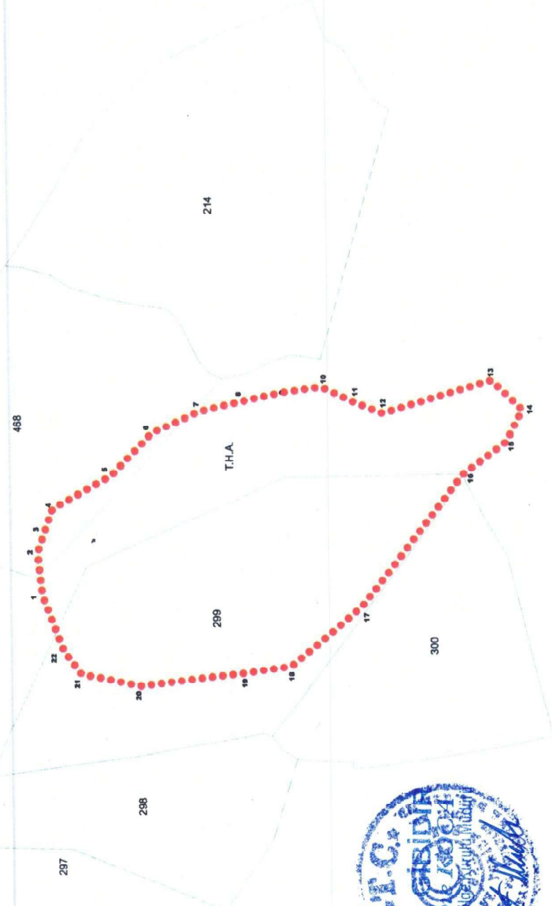
1.DERECE ARKEOLOJİK SİT SINIRINA AIT KOORDİNAT CETVELİ İTRF96 3 DERECE