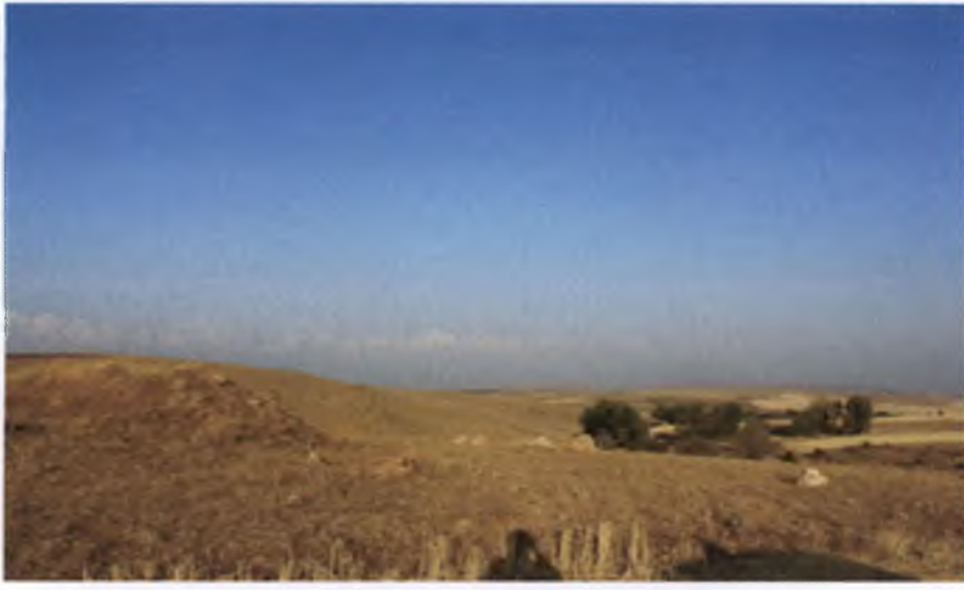
Yozgat ili, Merkez İlçesi, Tekkeyerlisesi köyü, Yeniceözü Yerleşimi