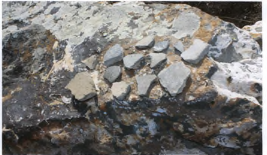
Yozgat İl, Sorgun İlçesi, Yedigöller Köyü, Kalecikaya Tepesi Yerleşimi