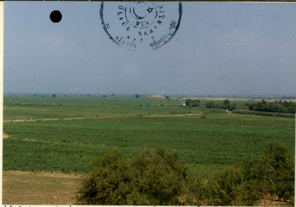
Küçükhöyük T. tepesinden Toygar tepesinin görünüşü