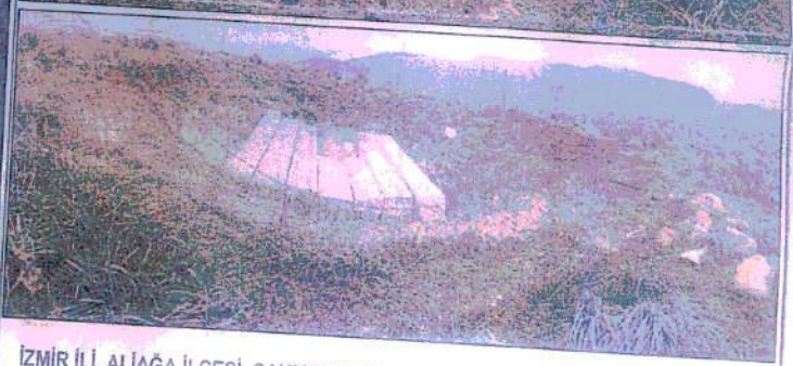
İZMİR İLİ, ALIAĞA İLÇESİ, ÇAKMAKLI MAHALLESİ, UZUNÇEŞMEÇAYIRI MEVKİİNDE YER ALAN TÜMÜLÜSTEN GÖRÜNÜM