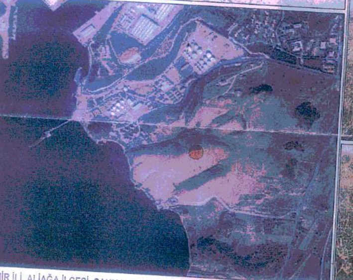
İZMİR İLİ, ALIAĞA İLÇESİ, ÇAKMAKLI MAHALLESİ, UZUNÇEŞMEÇAYIRI MEVKİİNDE YER ALAN I. (BİRİNCİ) DERECE ARKEOLOJİK SİT ALANININ TOPOGRAFİK HARİTA VE ORTOFOTO GÖRÜNTÜSÜ ÜZERİNDEKİ KONUMU