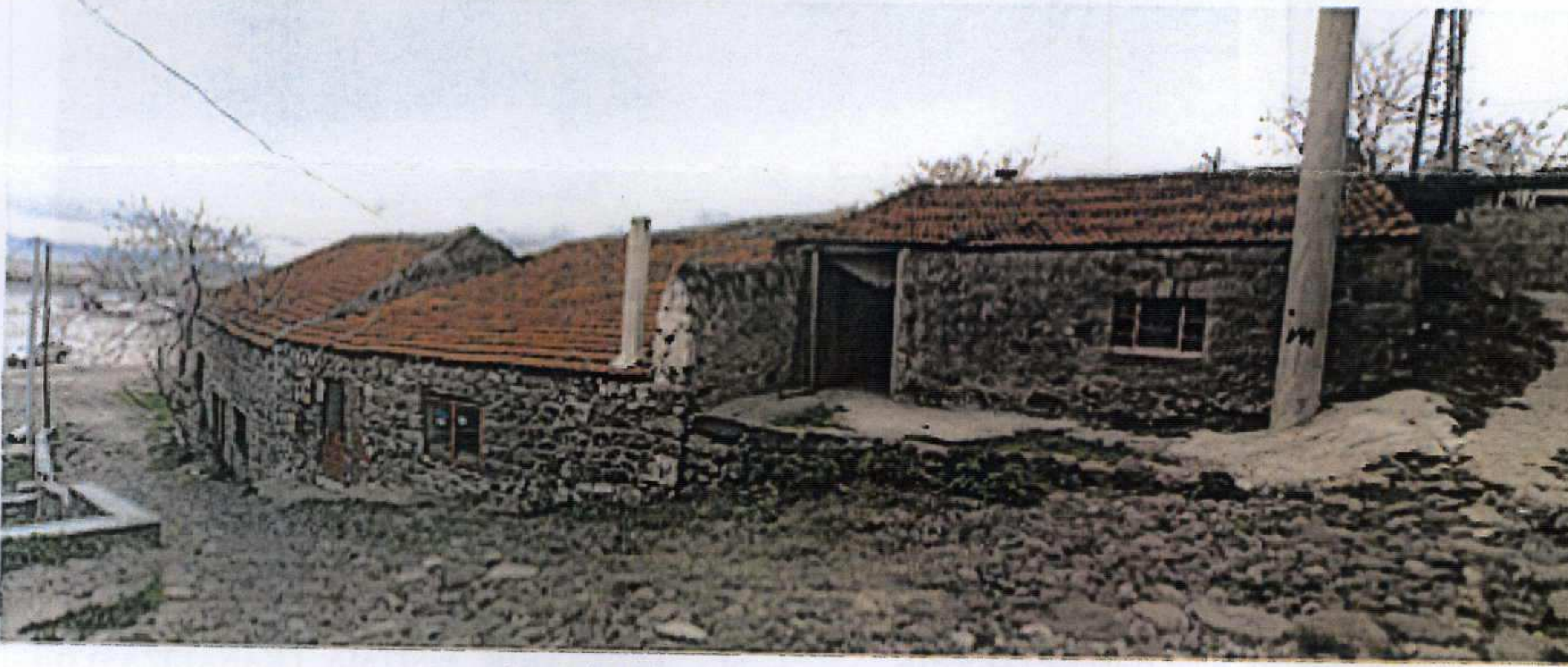
Yapıların birlikte görünümü