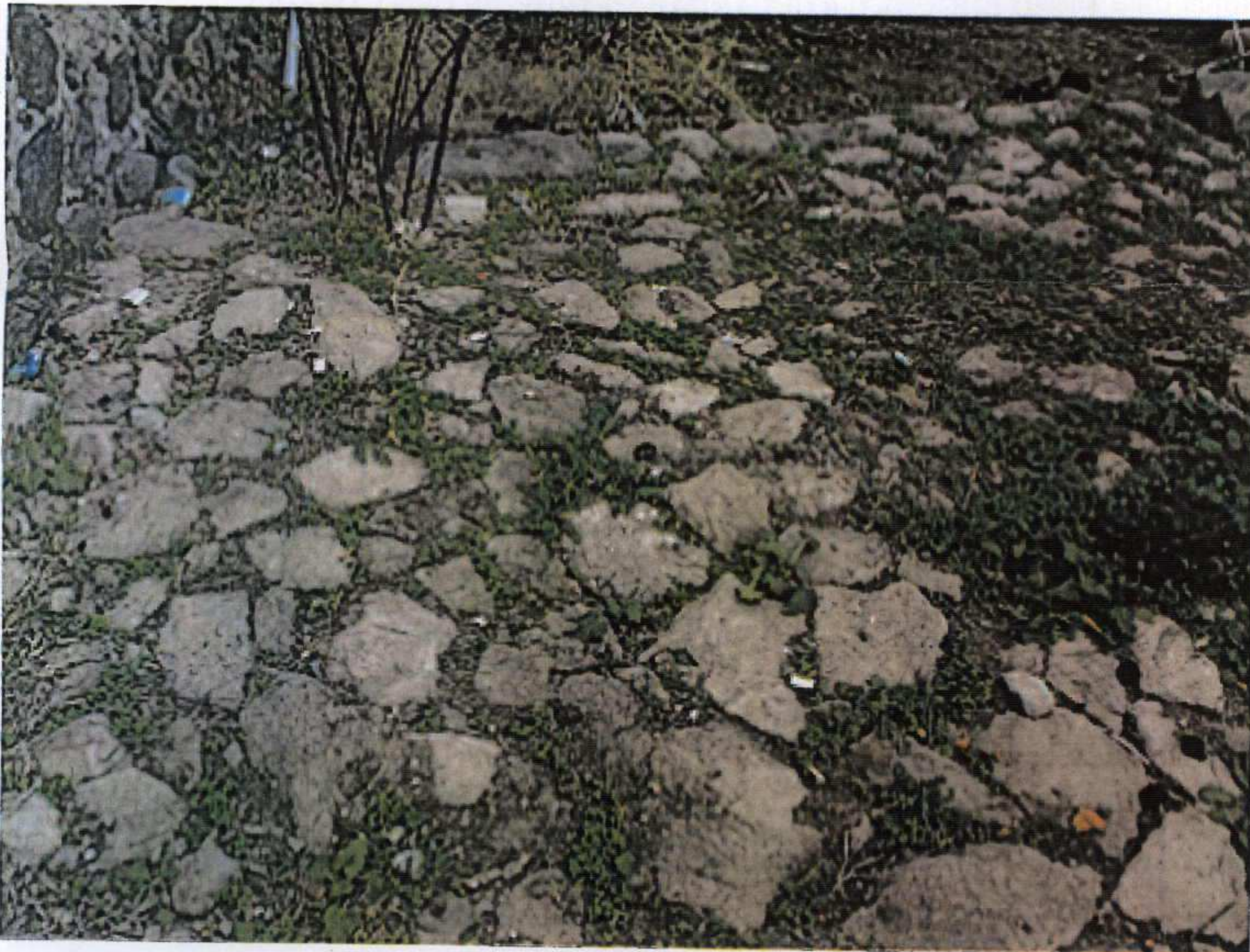
Deve damına ait olduğu düşünülen döşeme izi