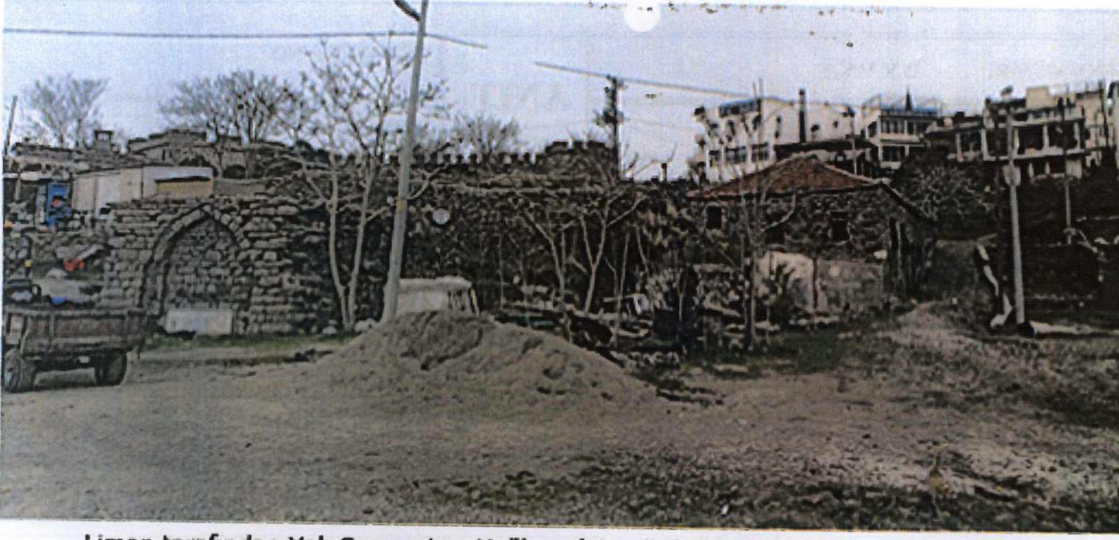
Liman tarafından Yalı Çeşmesi ve Yağhane'nin görünümü