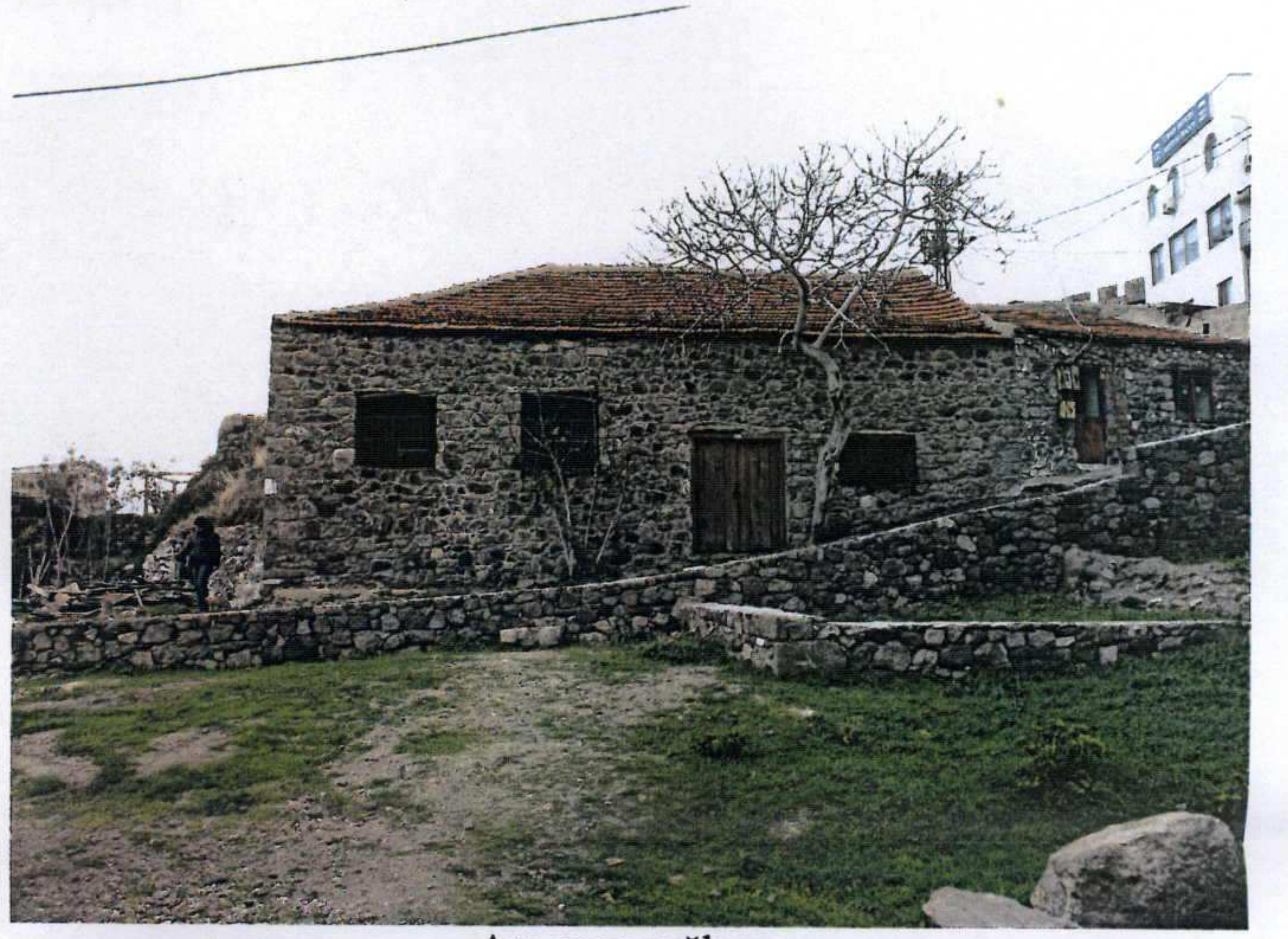
Ana yapı- yağhane

GÖZLEMLER: Parselde farklı kotlara oturan yağhane binası ve iki adet depo yapısı bulunmaktadır.