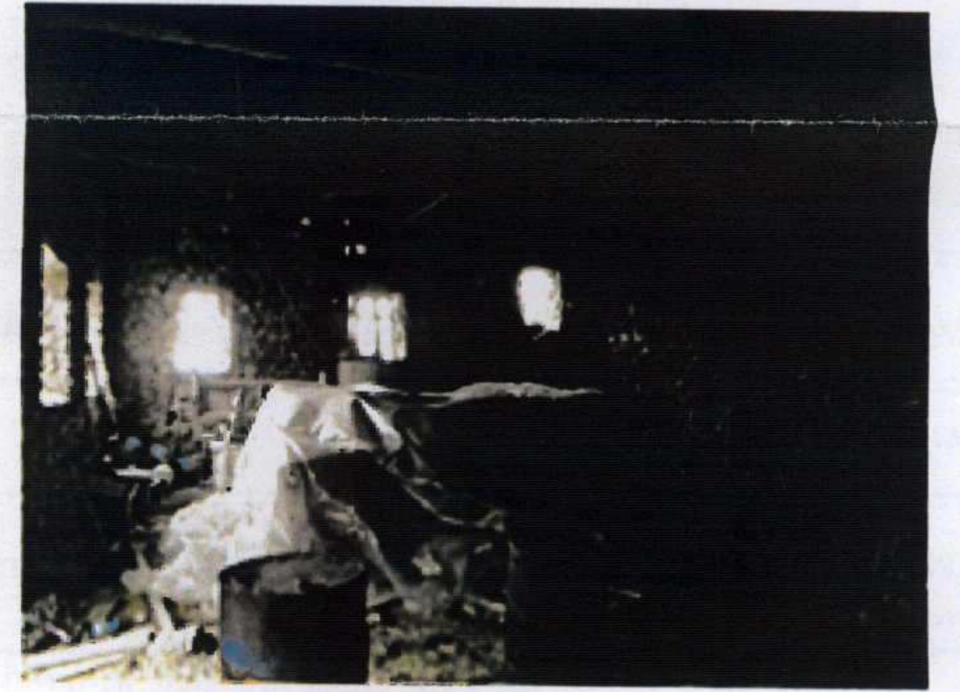
Yağhane yapısı içi