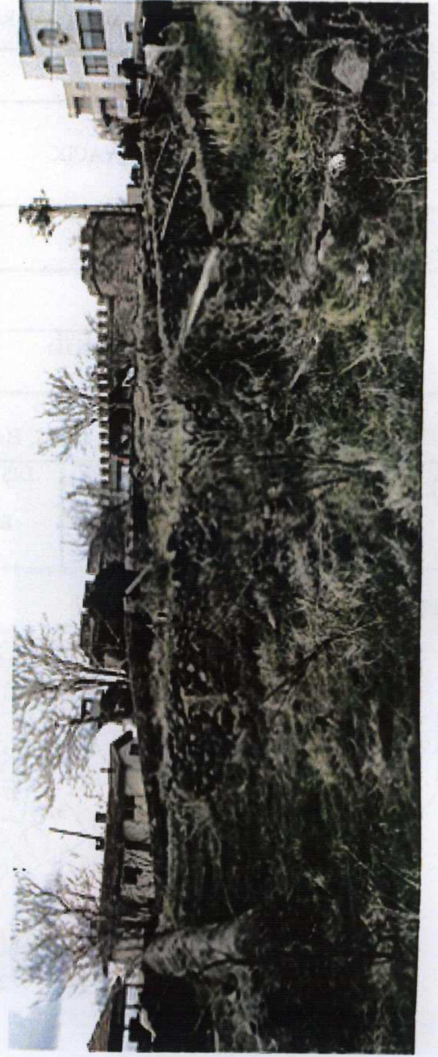
Arka bahçedeki ağaç zeytin depoları