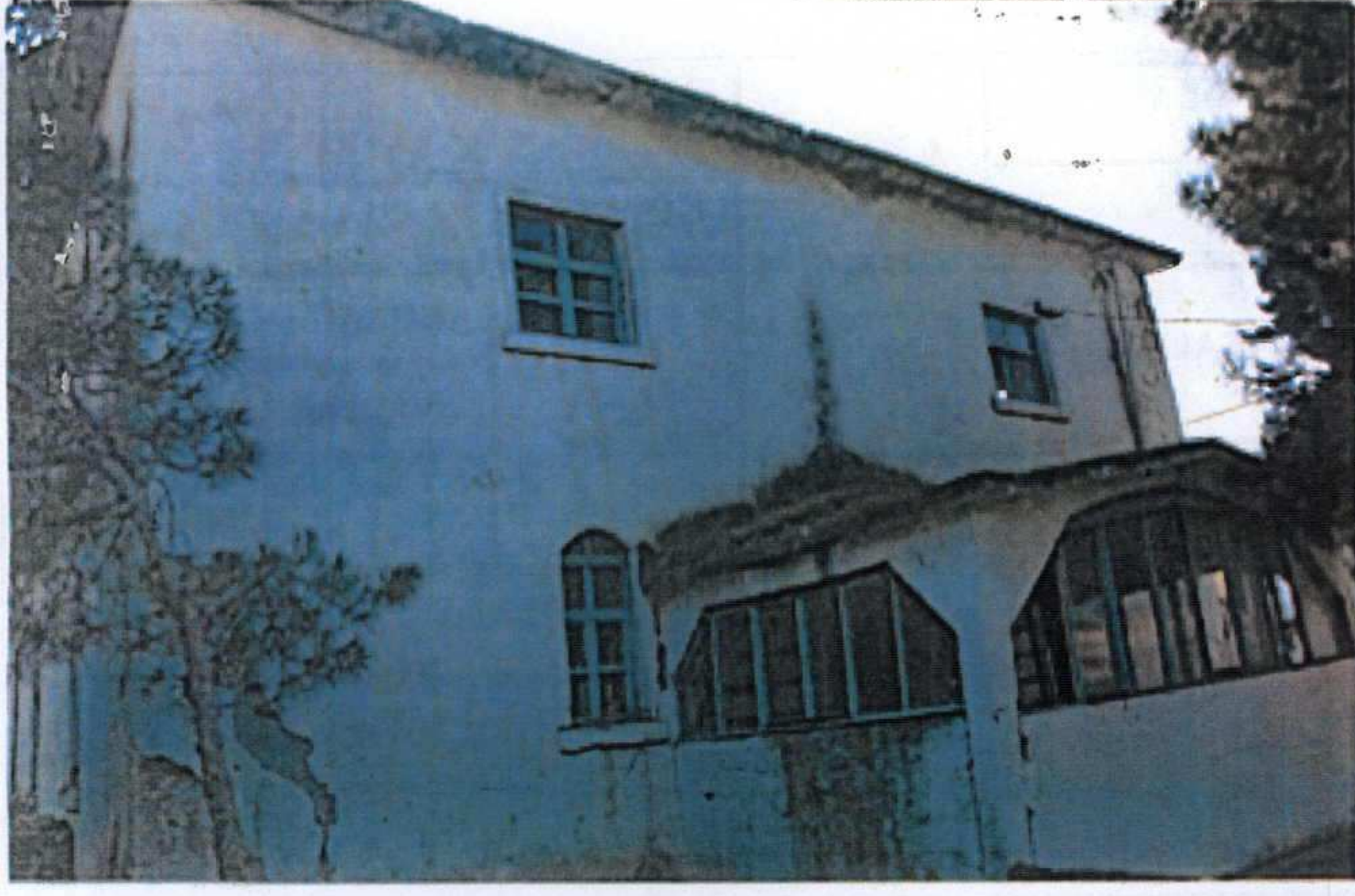
Ön cephe eski fotoğrafı