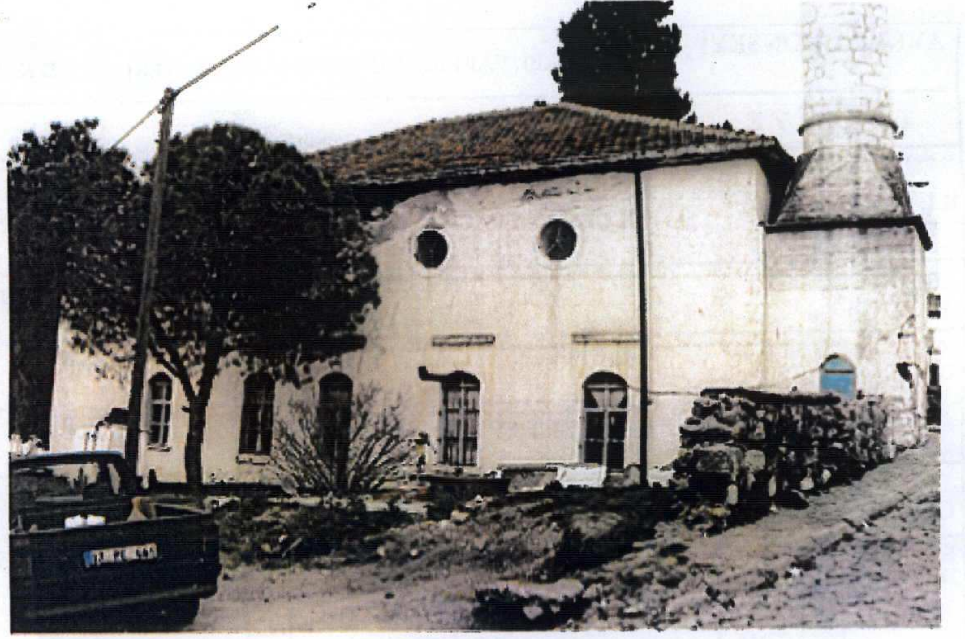
Sol yan cephe