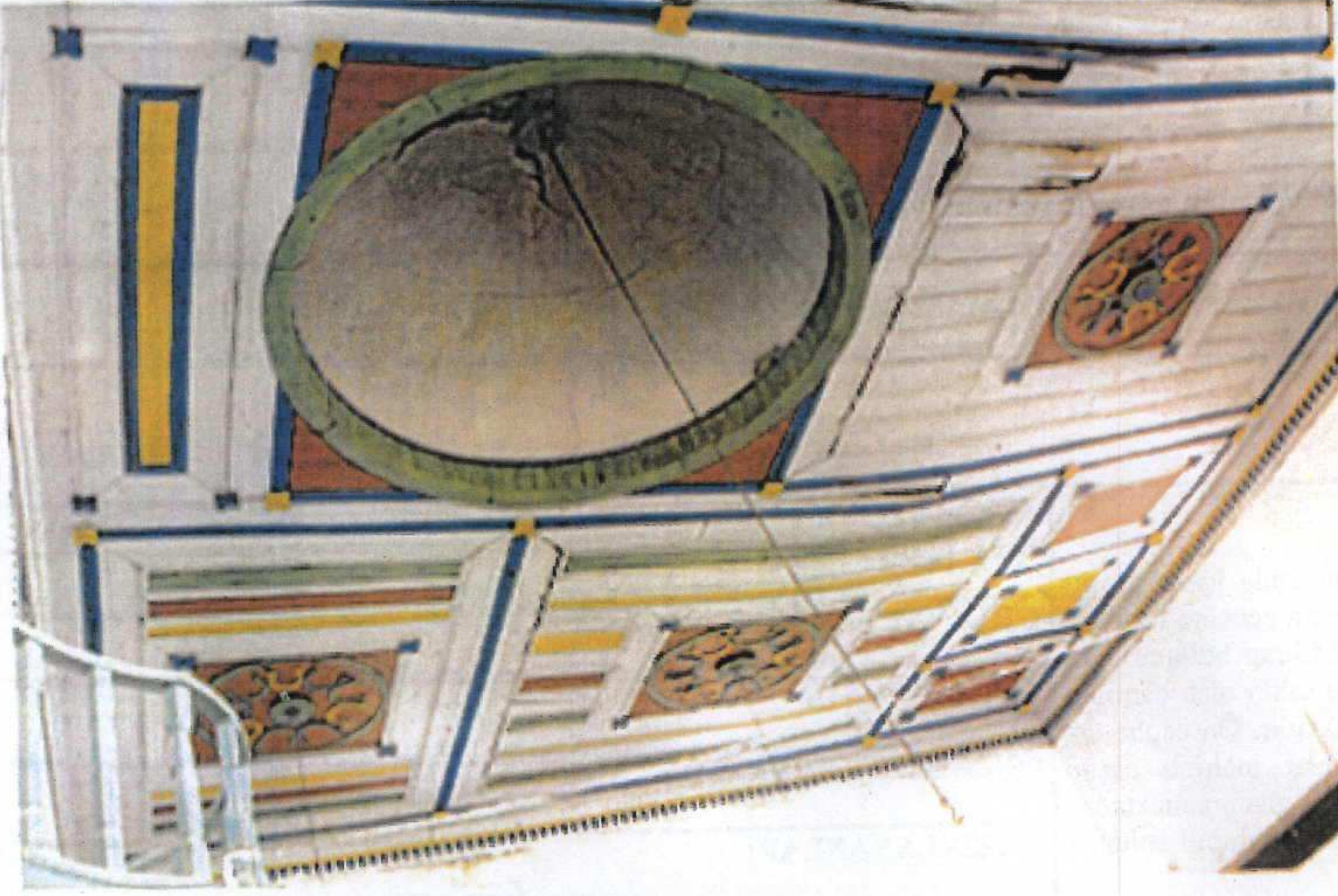
Tavan kaplaması ve ahşap kubbe