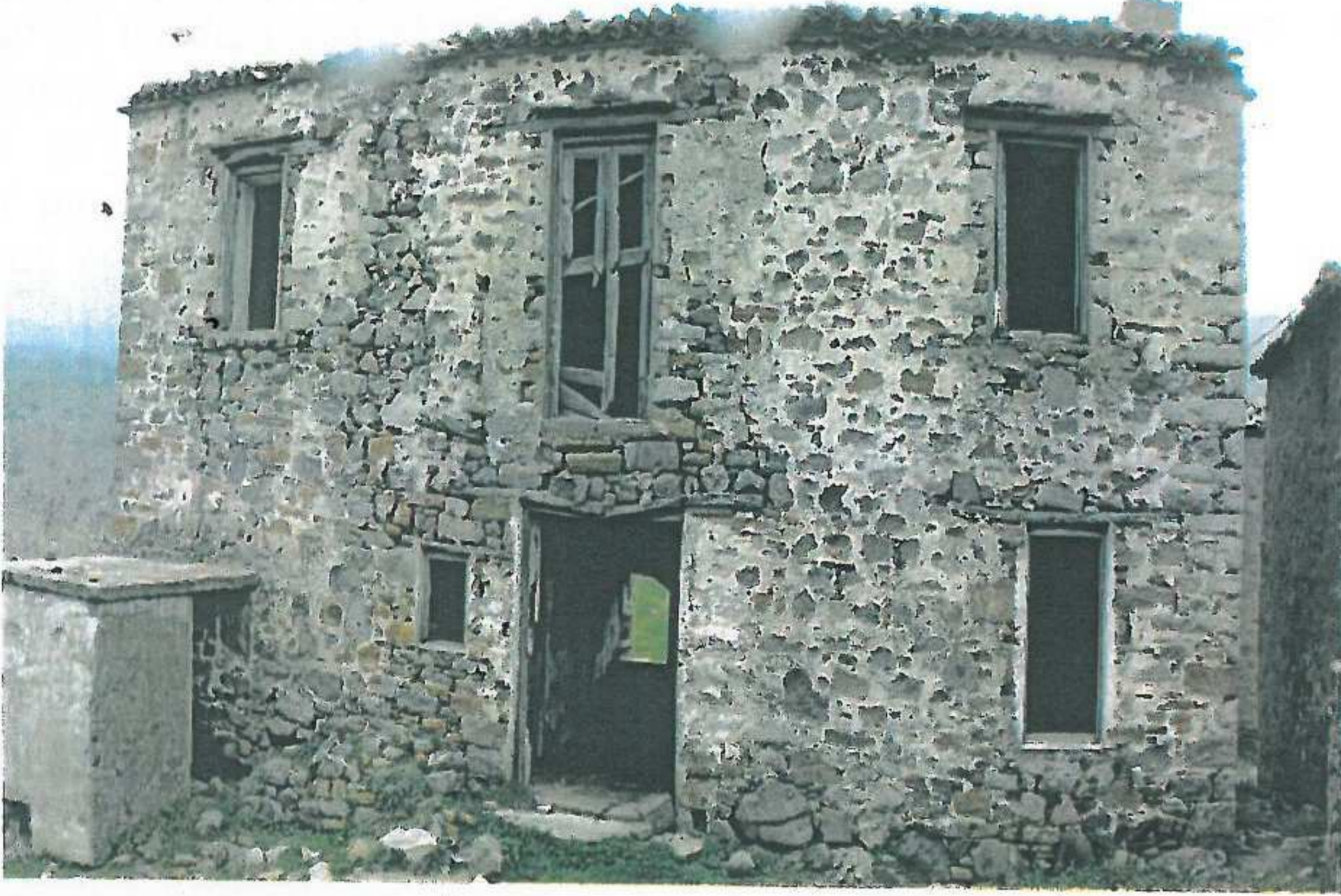
Yapının ön cephesi