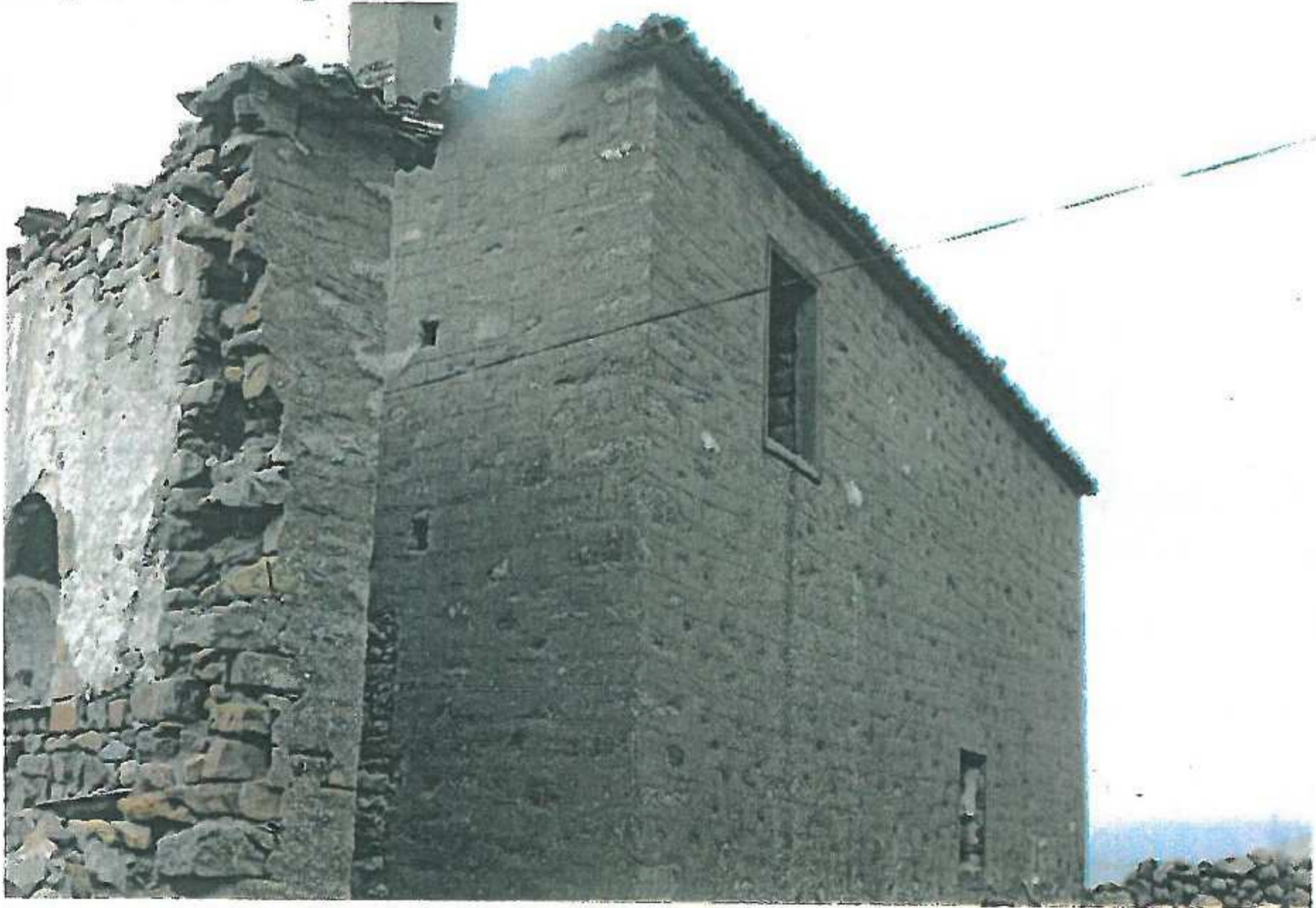
Yapının arka cephede bitişik parsel