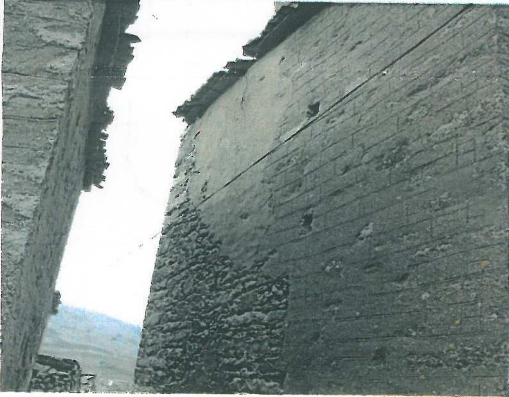
Yapının arka cephesi