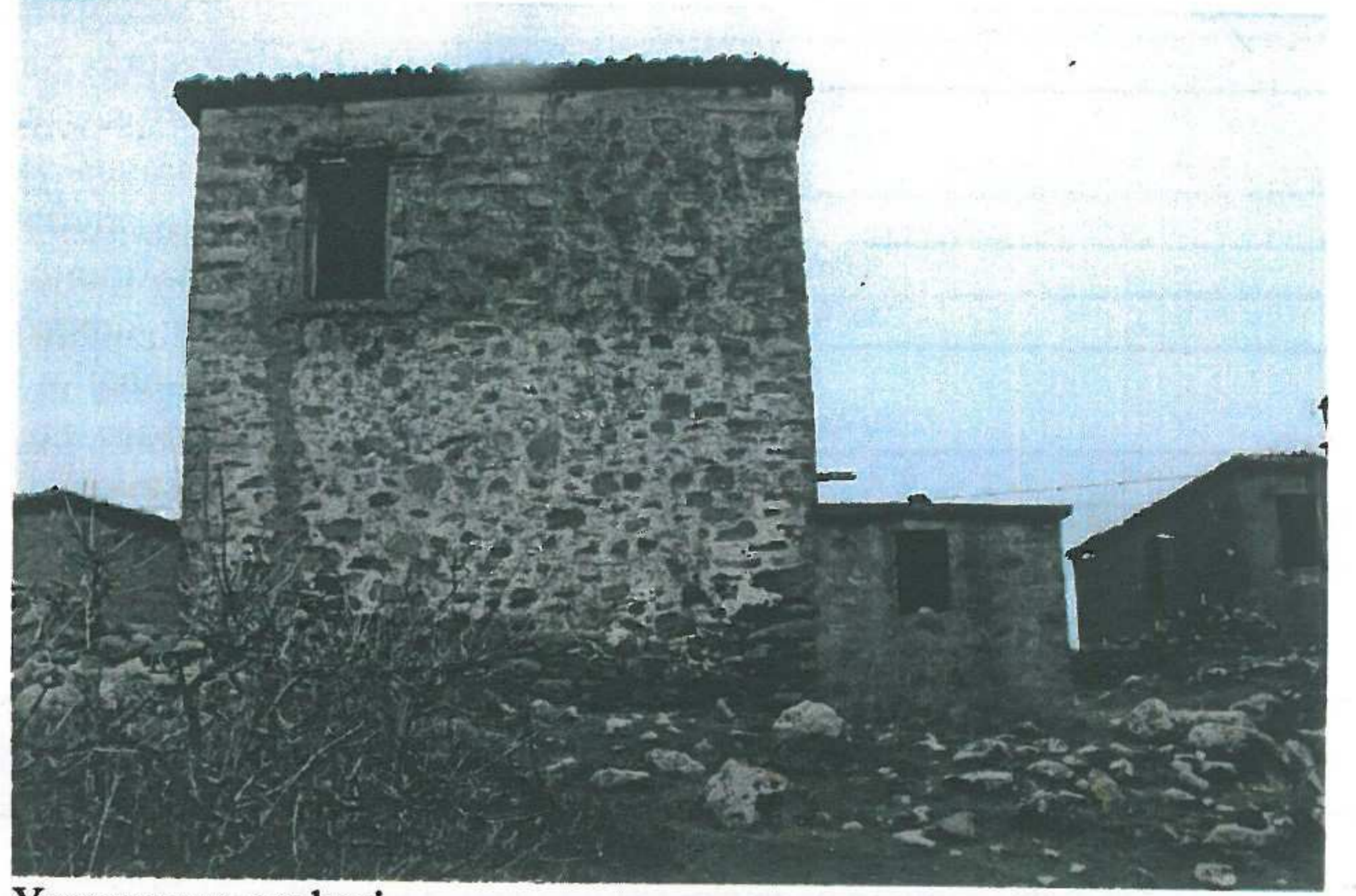
Yapının yan cephesi