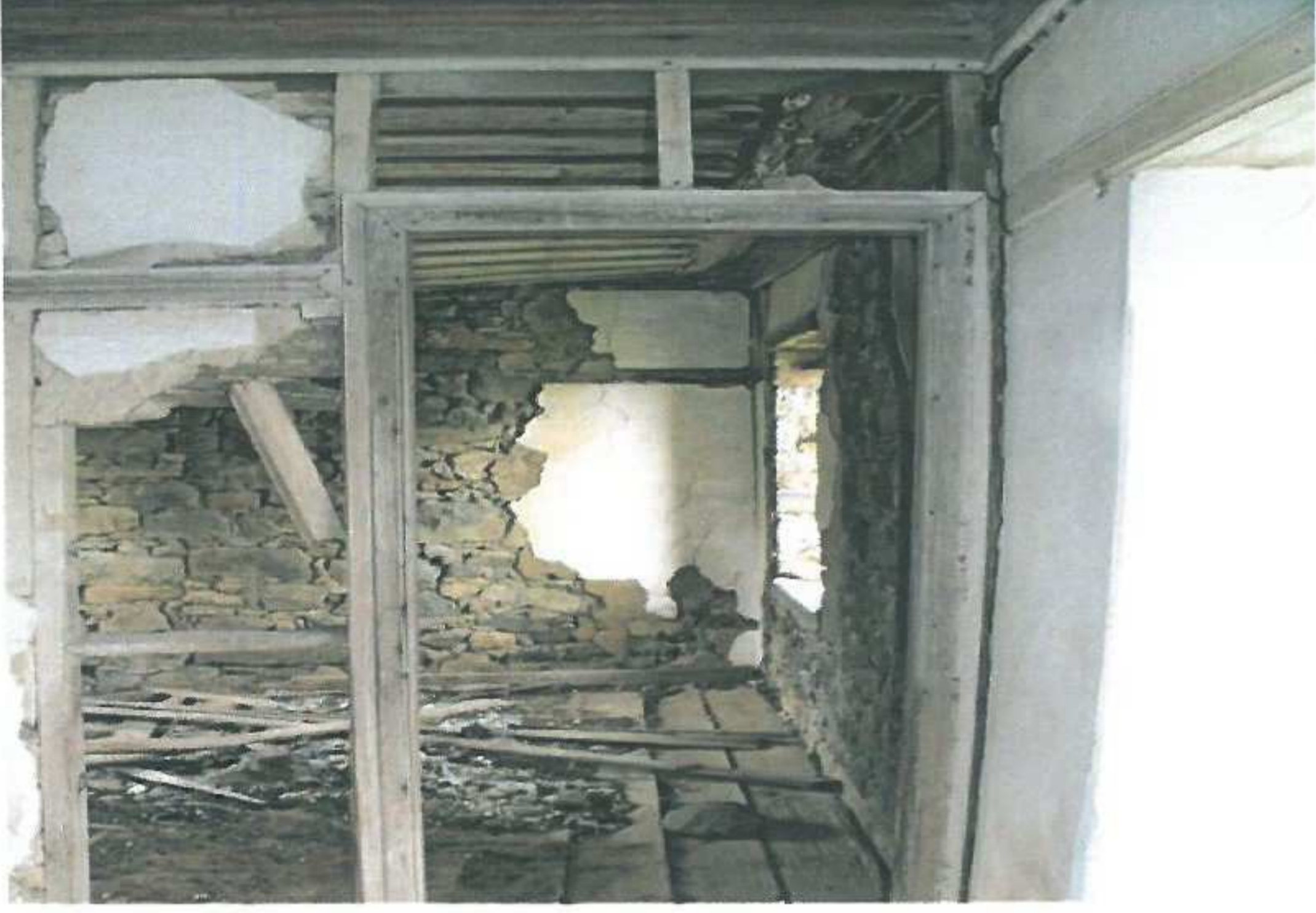
Zemin kat sağ taraftaki odanın giriş kapısı