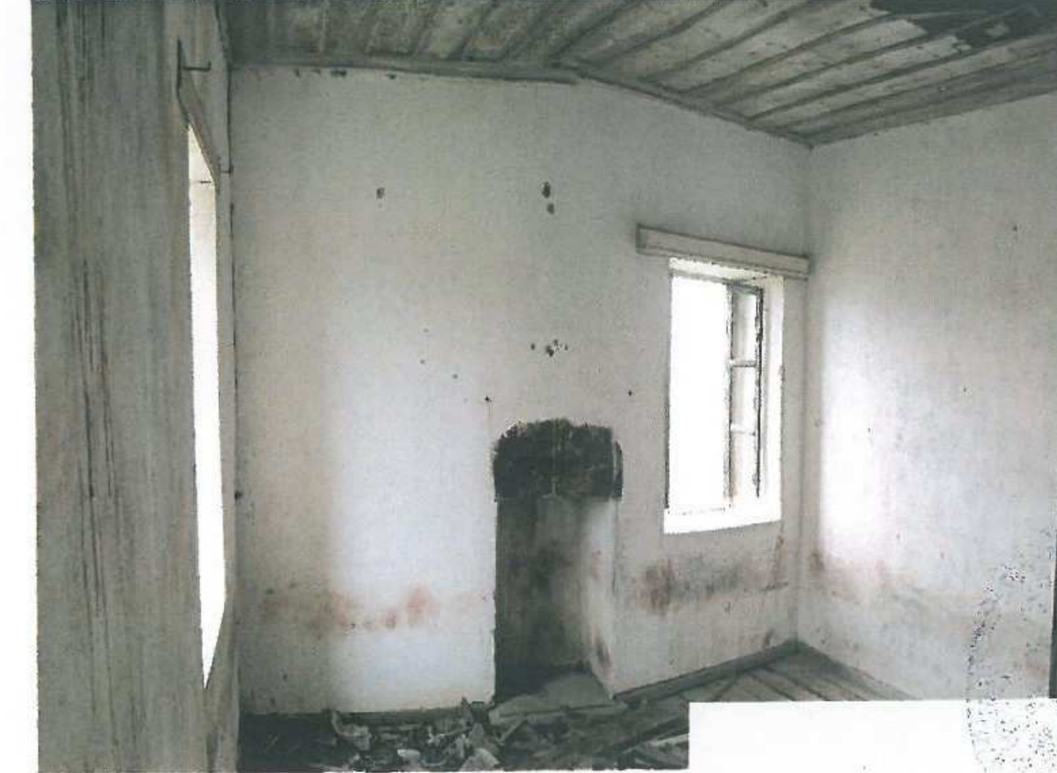
Sol üst kattaki oda