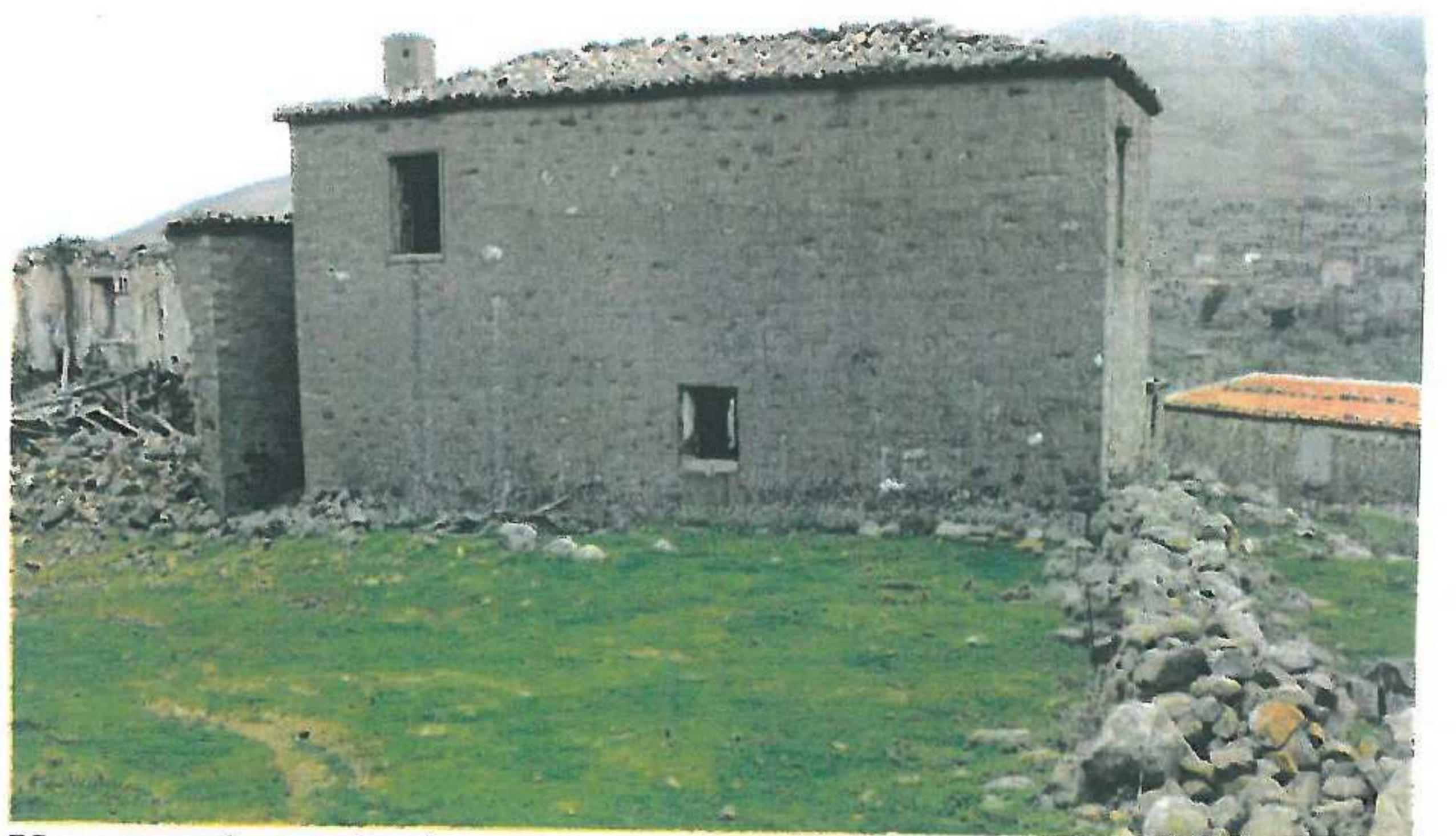
Yapının arka cephesi

Gökçeada, Dereköy, Köyiçi mevki 237 ada 45 parsel.