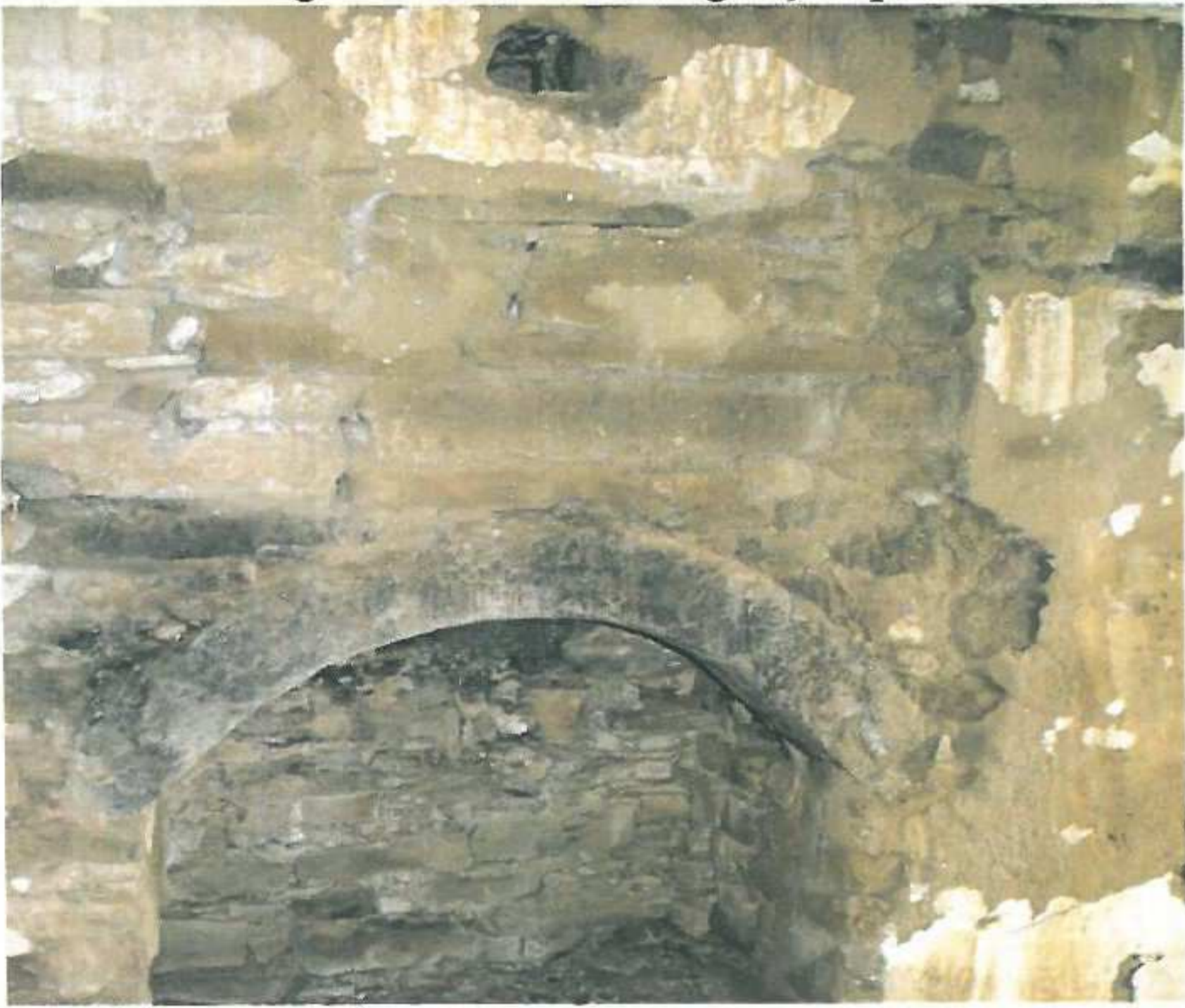
Sağ taraftaki oda, şömine