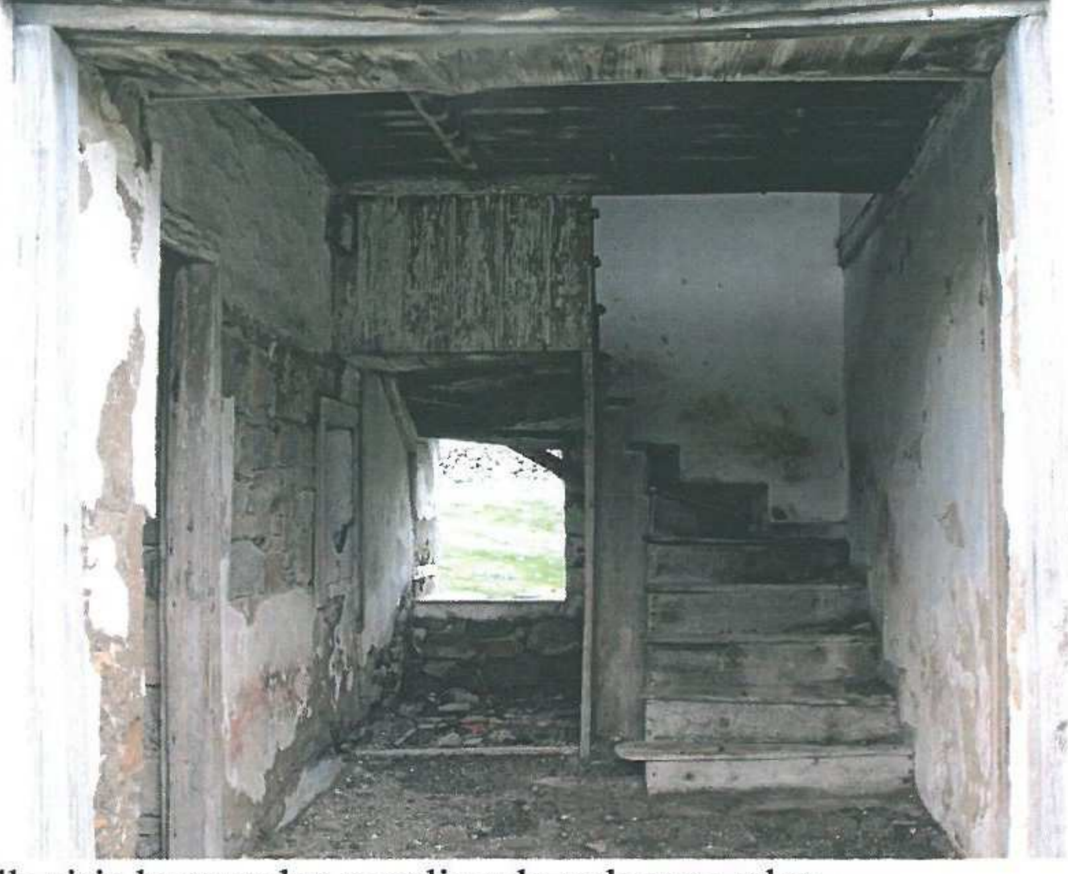
İlk giriş kapısından merdivenle yukarıya çıkış