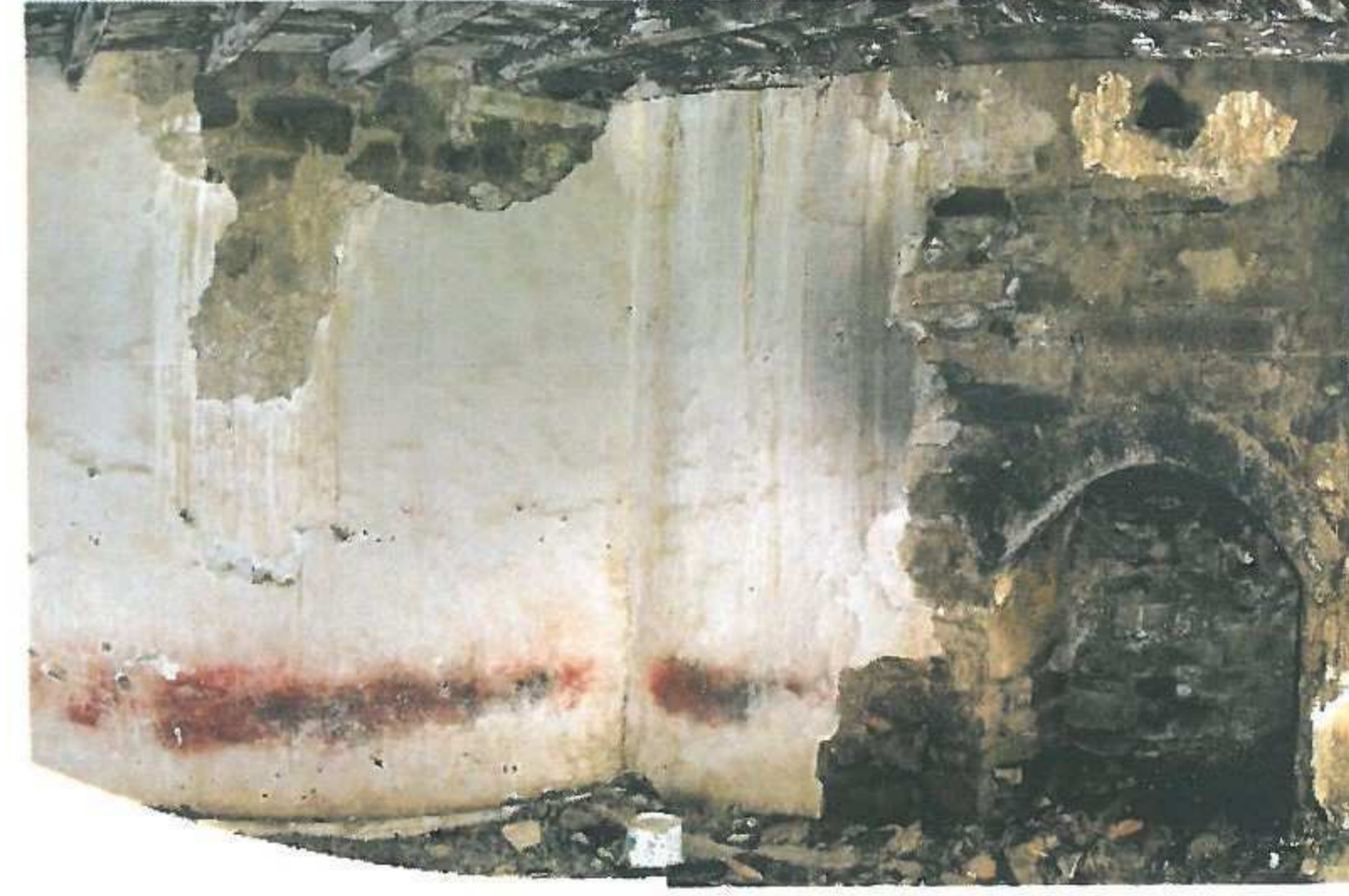
Sağ taraftaki oda, şömine