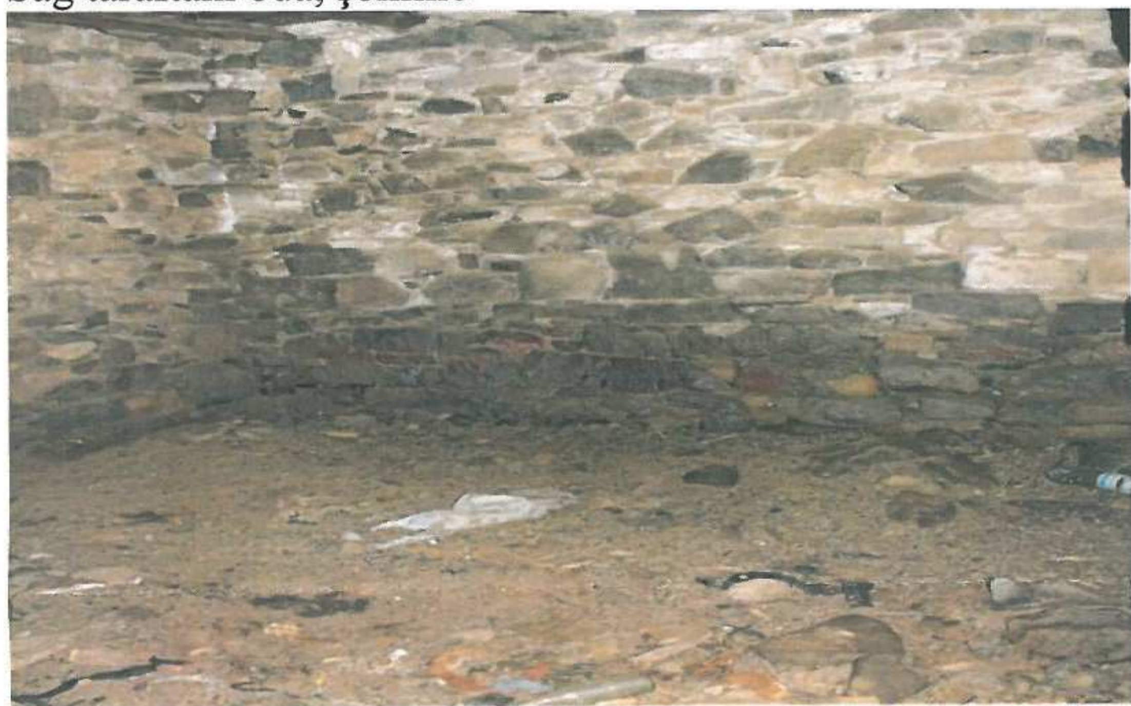
Zemin kat sol taraftaki oda.