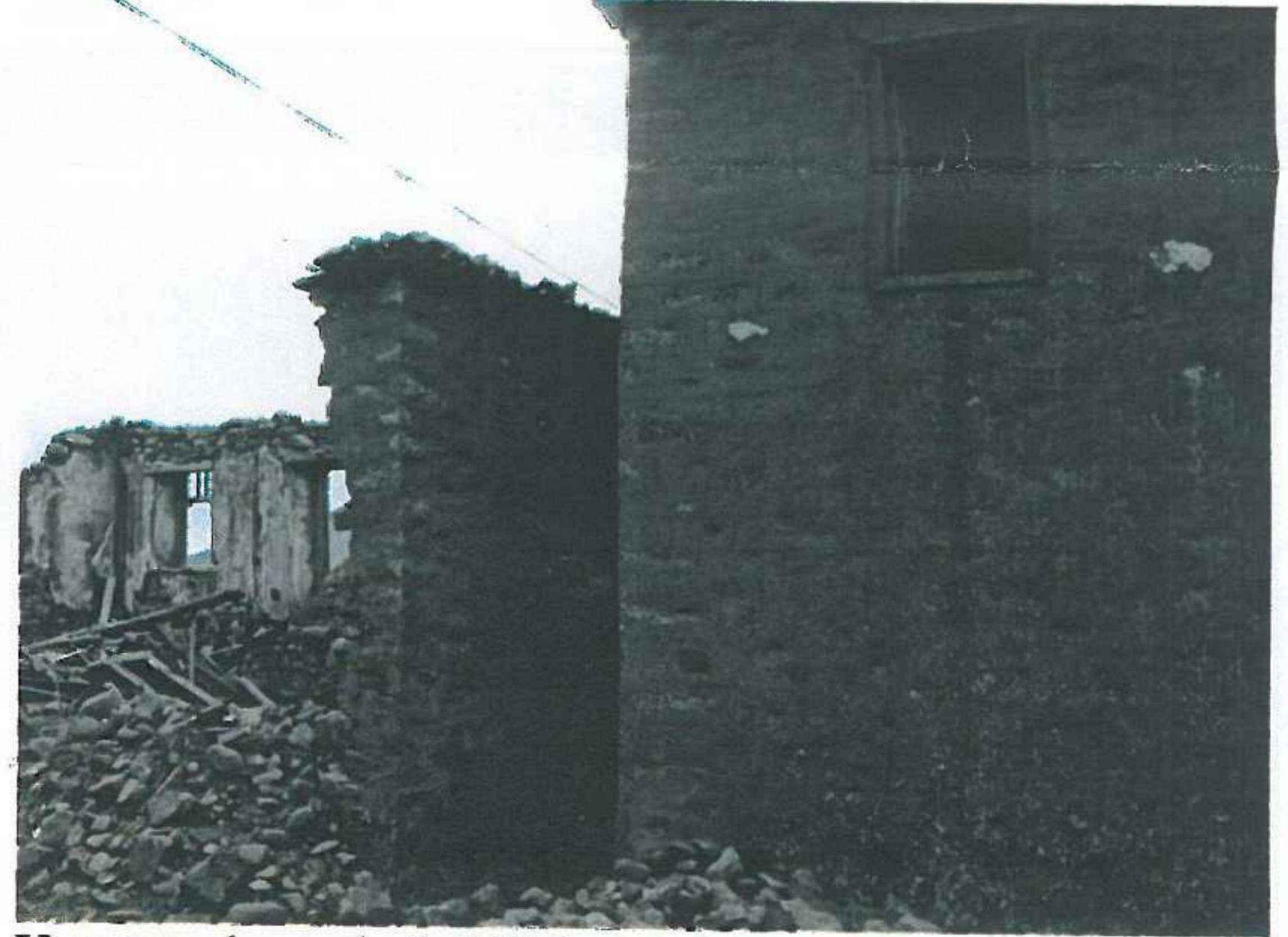
Yapının arka cephede bitişik parsel