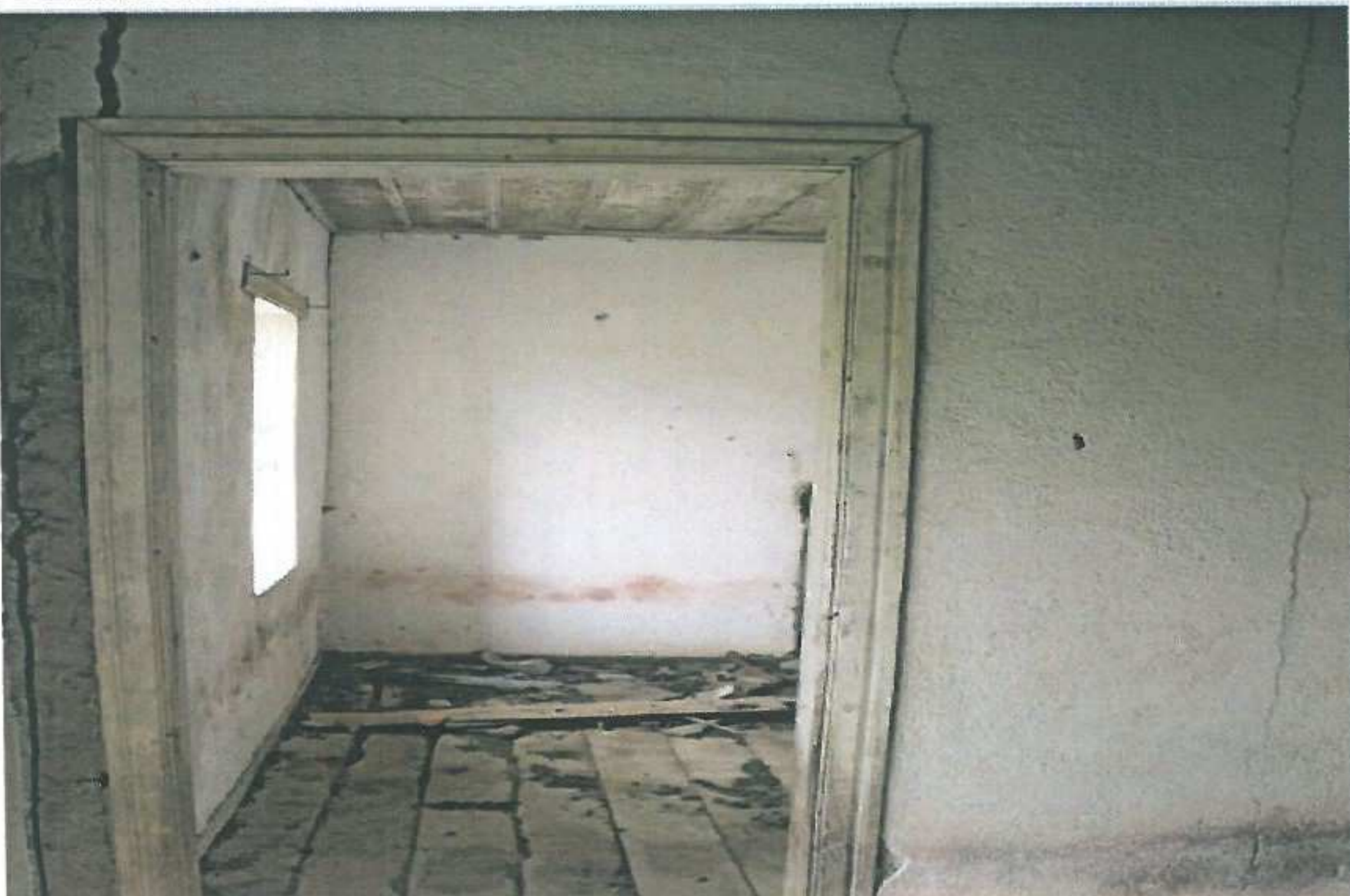
Sol üst kattaki odaya giriş kapısı