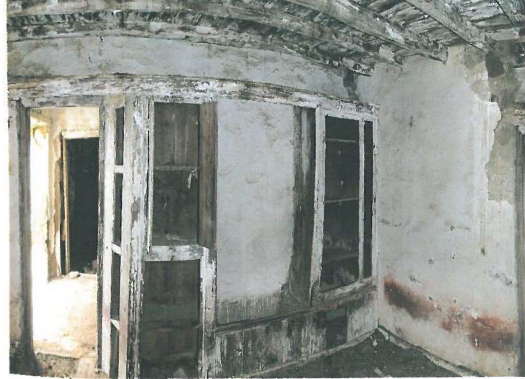
Sağ taraftaki oda, büfe