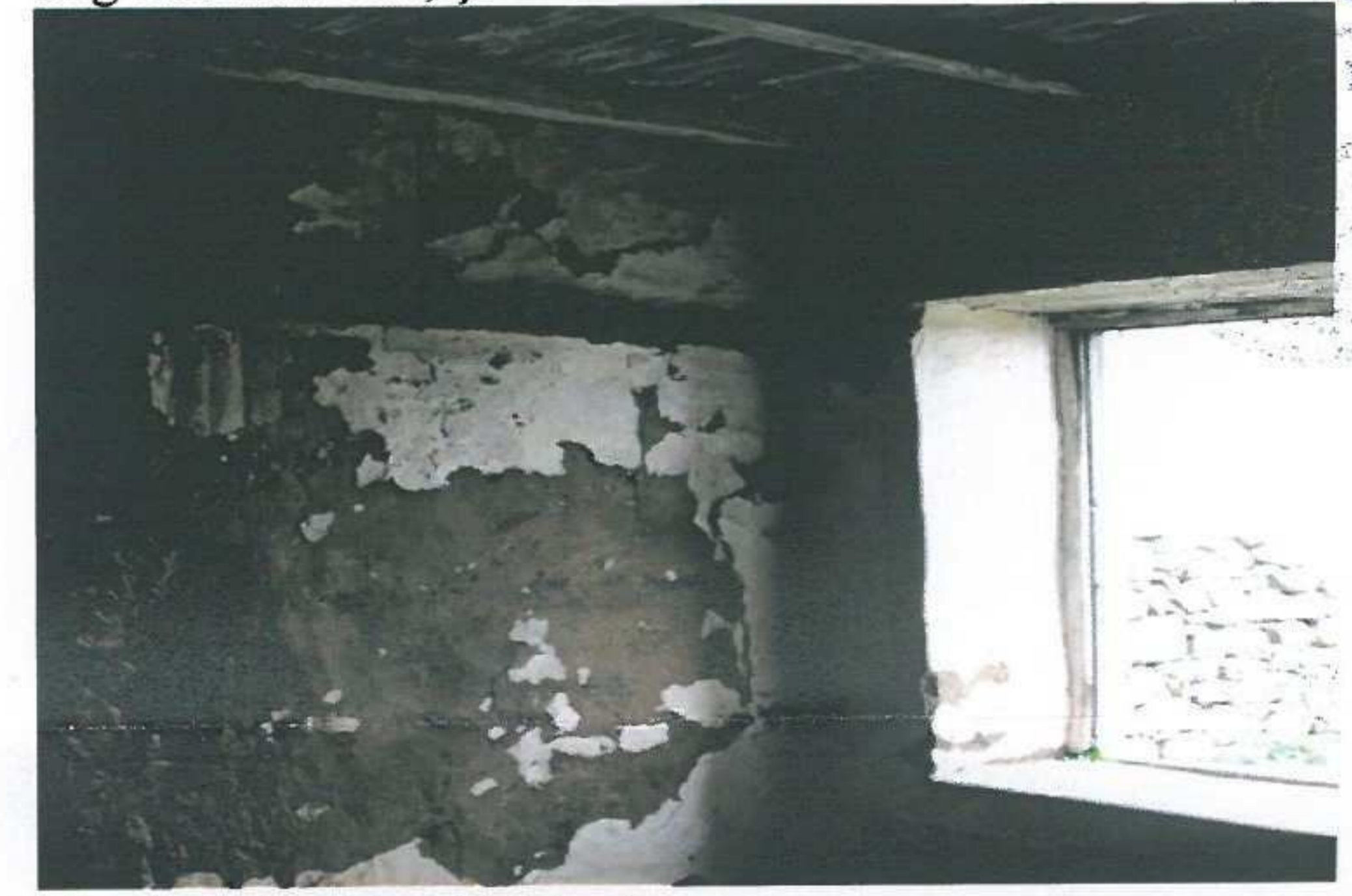
Zemin kat sol taraftaki oda.