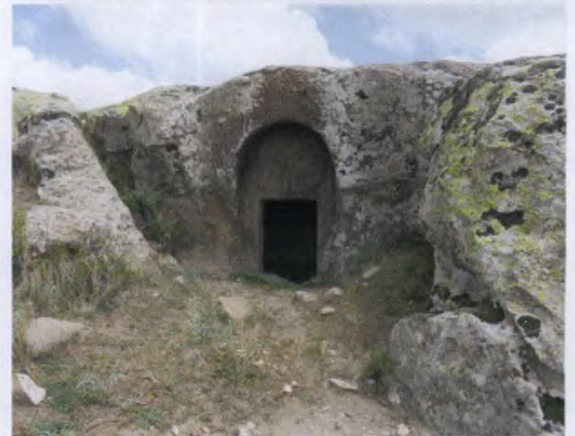
2. KAYA MEZARI