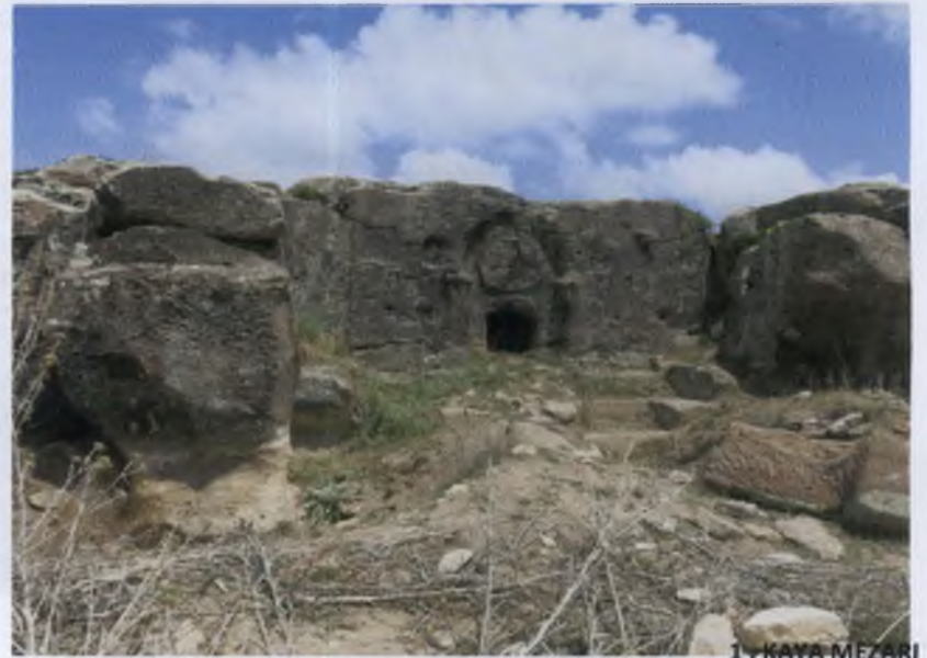
1. KAYA MEZARI