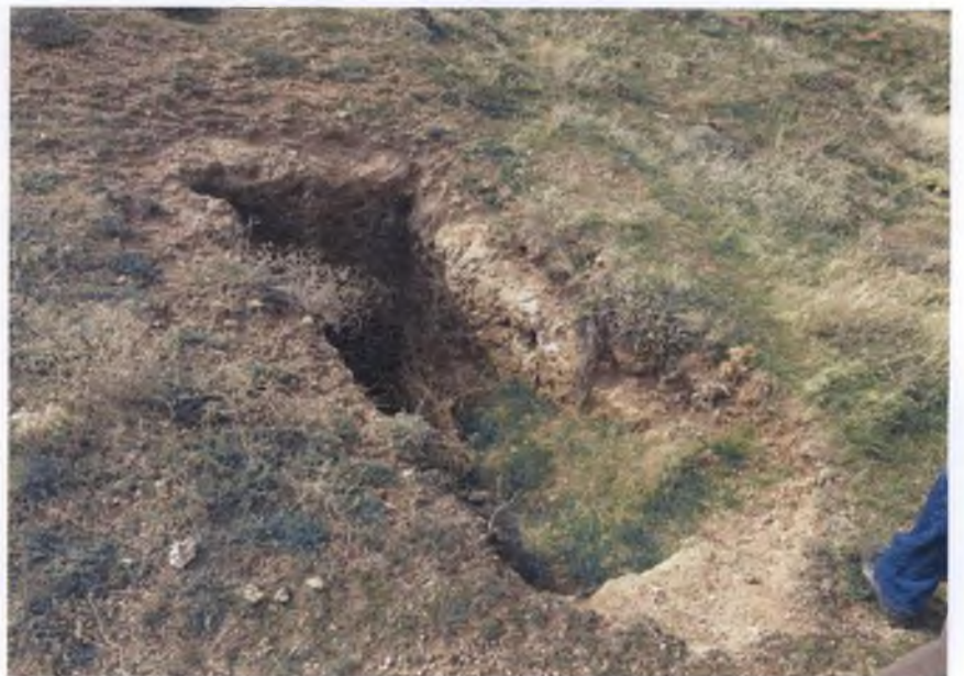
1. DERECE ARKEOLOJİK SİT ALANI