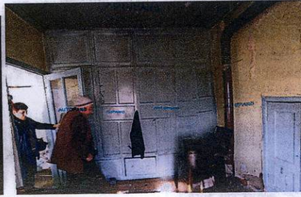
Doğu yönündeki odadan görüntüler