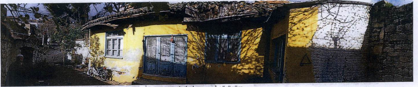
Avludan genel görünüm