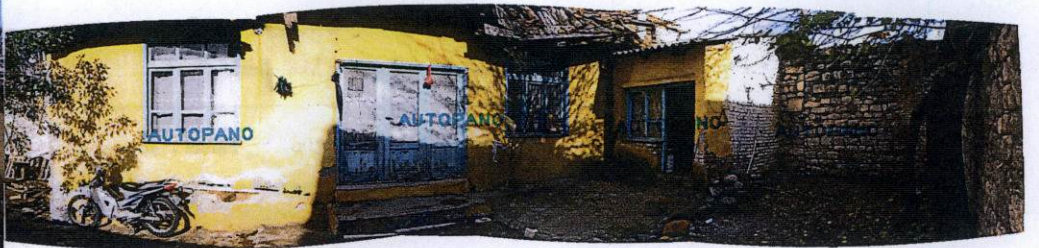
Güney (ön) cephe ve doğu yan cephesindeki eklentinin görünümü