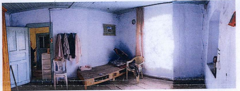
Batı yönündeki odadan görüntüler