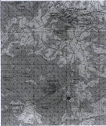
HARİTALAR, FOTOĞRAFLAR : İzmir -K20-A2