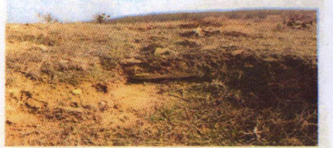
Kirantarla Nekropolünün kaçak kazılarla tahrip edilen mezarlardan görüntü (res; 3,4,5 ve 6)

T.C KÜLTÜR VE TURİZM BAKANLIĞI Kütahya Kültür Varlıklarını Koruma Bölge Kurulu Müdürlüğü