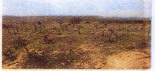
Kirantarla Nekropolünün genel görünümü (res;1,2).