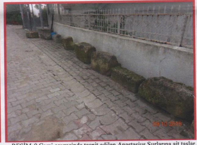
RESİM-9 Cami çevresinde tespit edilen Anastasius Surlarına ait taşlar.

Resimler :Silivri İlçesi, Bekirli Köyü, 402 parselde yer alan tescilsiz caminin mevcuttaki hali.