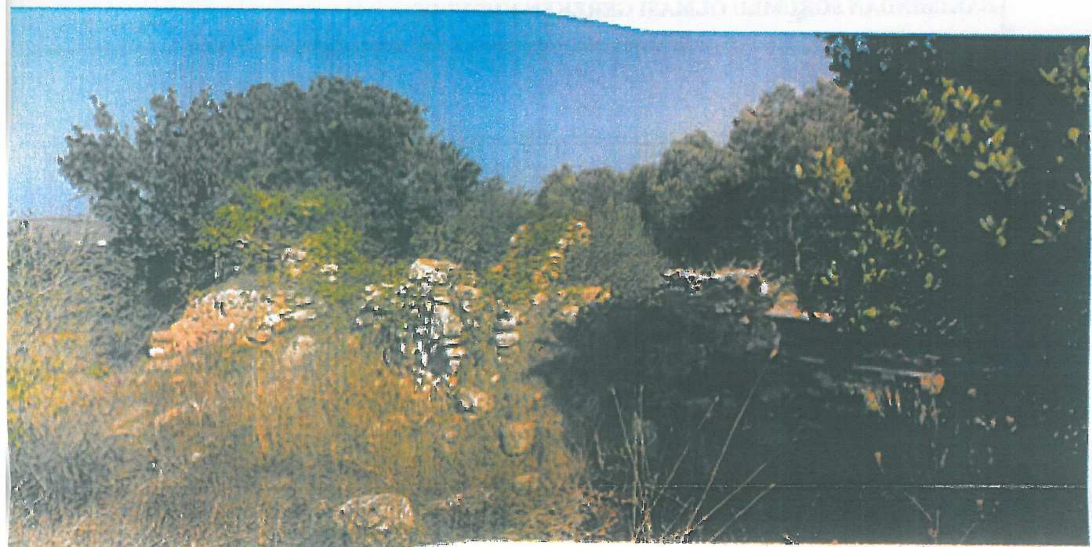
Waldweg am Berg 3 2. 10. 1978