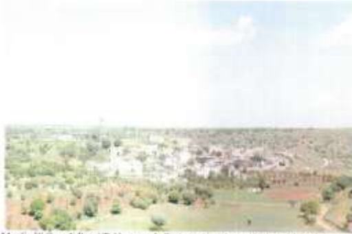
Mardin İli Ömerli İlçesi Tekkuyu mahallesi, genel görünüşü ve kayı yaşam alanı