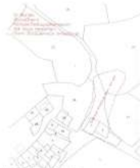
Alanın öneri sit haritası