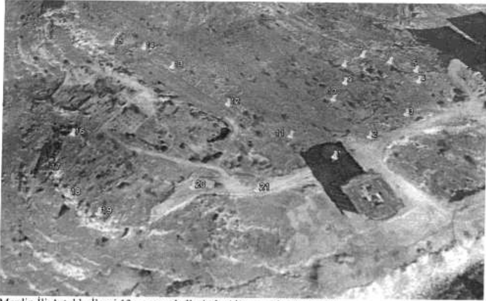
Mardin İli Artuklu İlçesi 13 mart mahallesinde Alanın uydu görüntüsü